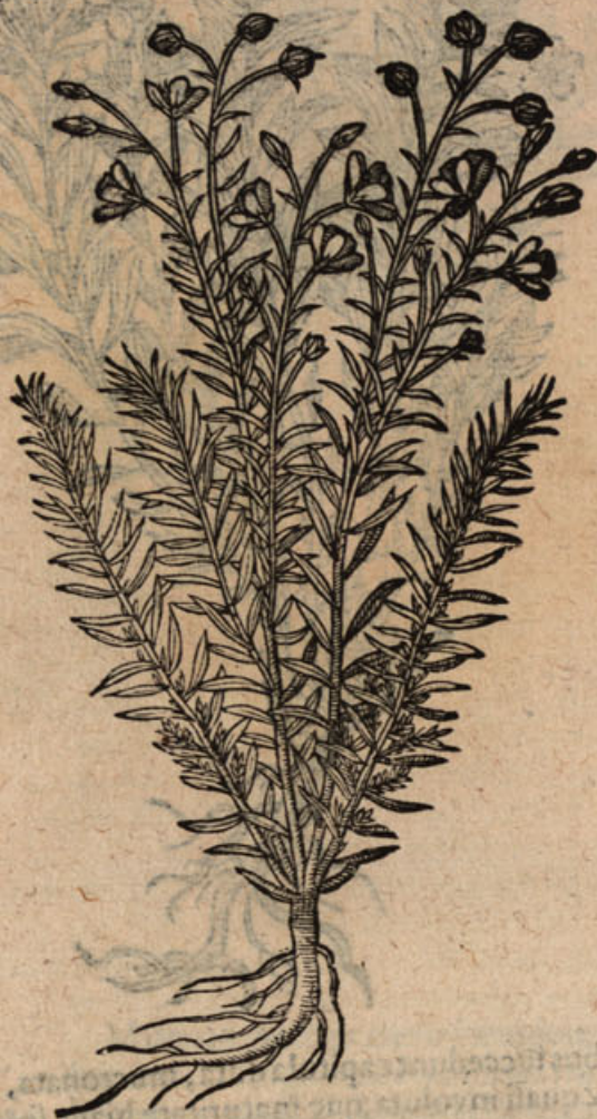
Linum silvestre IIII. angustifol. I.