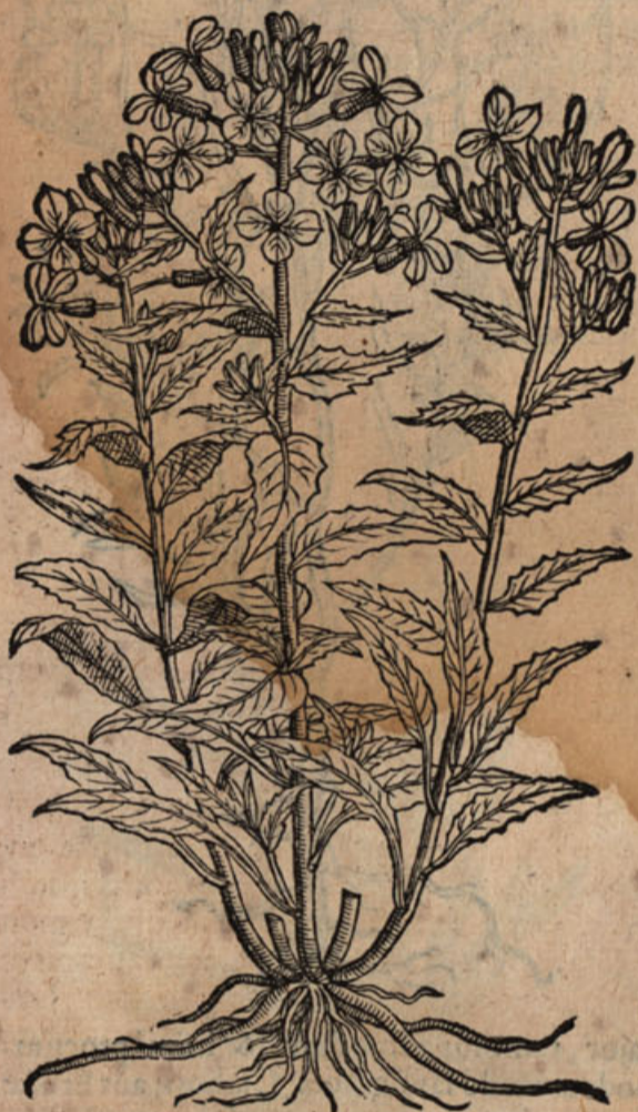
Viola latifolia, Lunaria odorata.