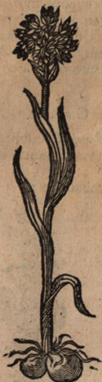
Orchis Pannonica viii.