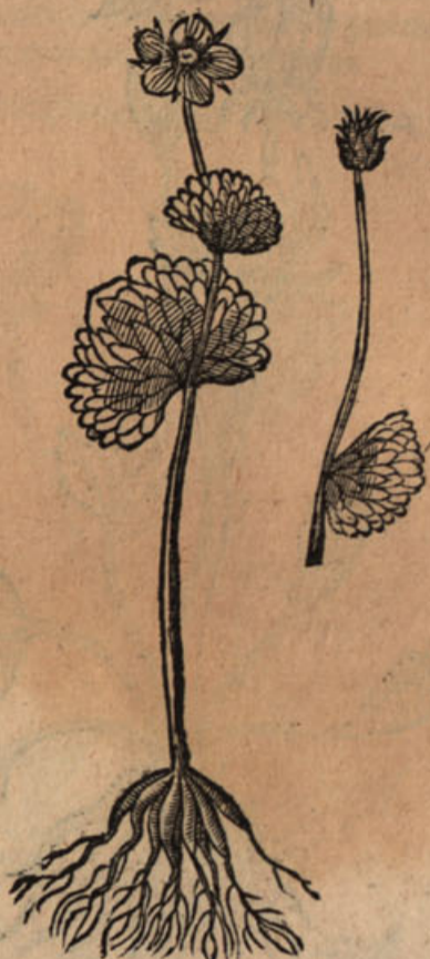
Pthora Valdensium, montis Baldi.