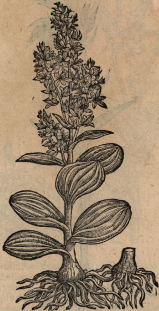
Elleborus niger legitimus.