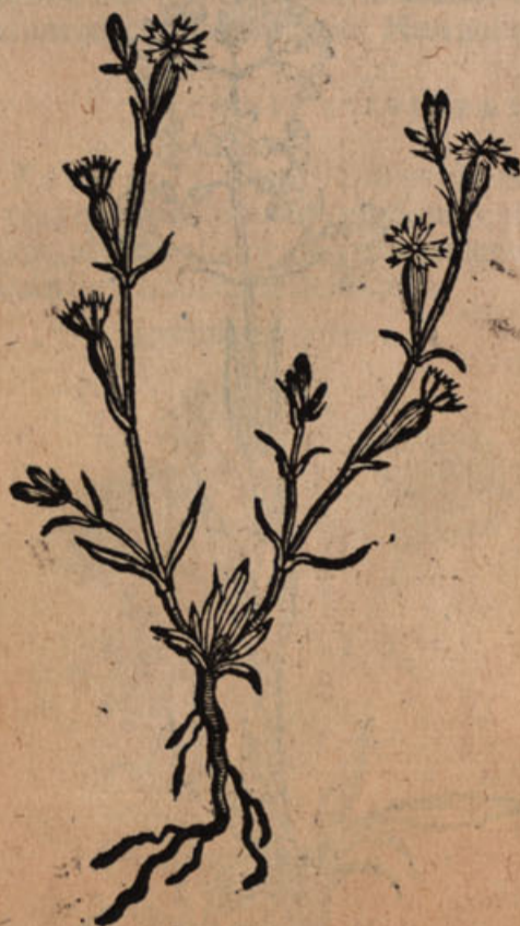
Lychnis silvest. viii.