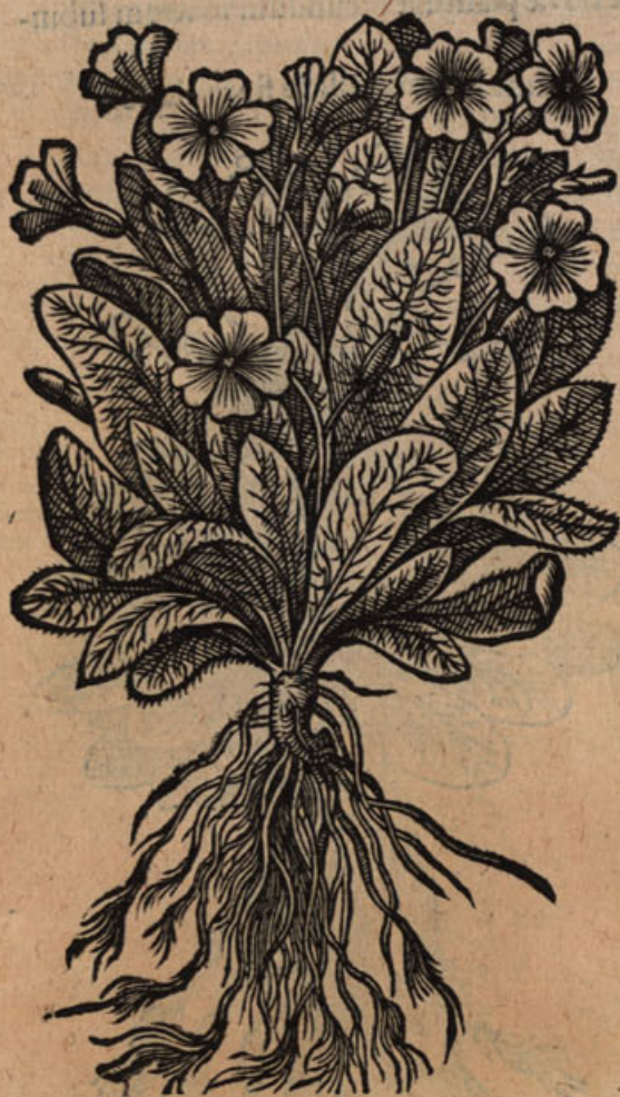
Auricula urfi 1.

VARIA autem apud rei Herbariæ studio- sos obtinuit nomina Primula veris vulgò di- cta Belgis. Nam sunt qui φλομίδες Dioscoridis esse putent, Fuchsius verbascula vertit. Alij Dodecatheon herbam, quâ Plinius Nat. Hist. lib. xxv. cap. 1111. describit folijs septenis, la- ctucis simillimis, è radice lutea exeuntibus. Vulgus Herbam paralyfim, Clavem S. Petri, Itali Lactucam silvestrem, Germani himelschlus- sel / & Schlusselflumen . Angli Primrosen & Cowe syppe . Ungari humilem & ἀκαυλον maximâ co- piâ ubique in silvis cæduis apud eos nascentem, Kacha verág hoc est, pultis ex panico aut milio confectæ (quam illi Kacha vocant) flo- rem, quia pultis illius quæ pallida est, colorem imitatur. Hanc ego, cum in Angliâ essem, ubi etiam in cæduis silvis abundè provenit, lactei candoris flore conspiciebam, & aliquot stir- pes amicis in Belgicam inde mittebam. Sed & ab Anglis primùm acceperunt Belgæ tam hu- mitem quàm elatiorem, quæ florem habent multiplici foliorum serie constantem, & om- nes ferè reliquas coronarias plantas, quarum flores πολύφουλοι .