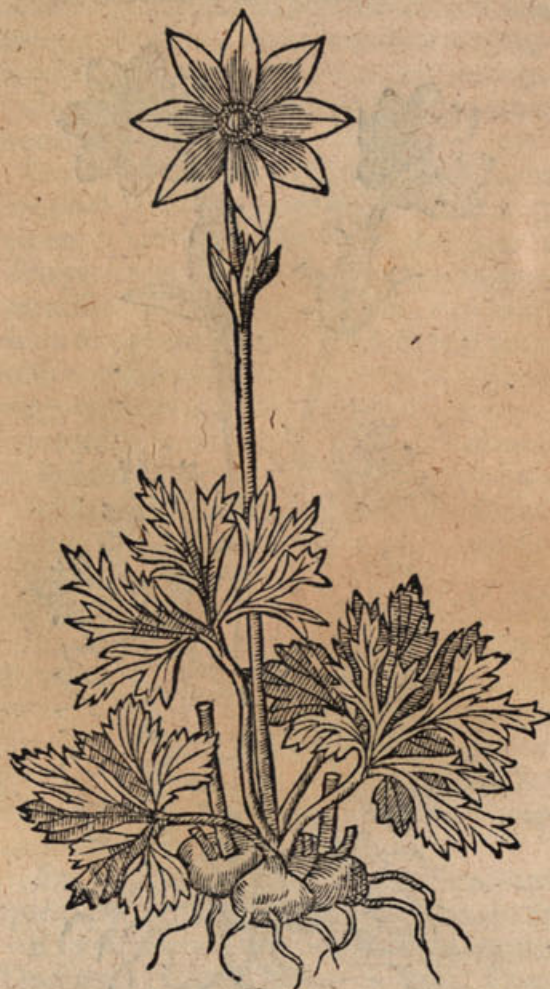
Anem. hortens. tenuif. simpl. flore i.

Summa coloris varietas in Anemoni- du semine na- ta floribus.