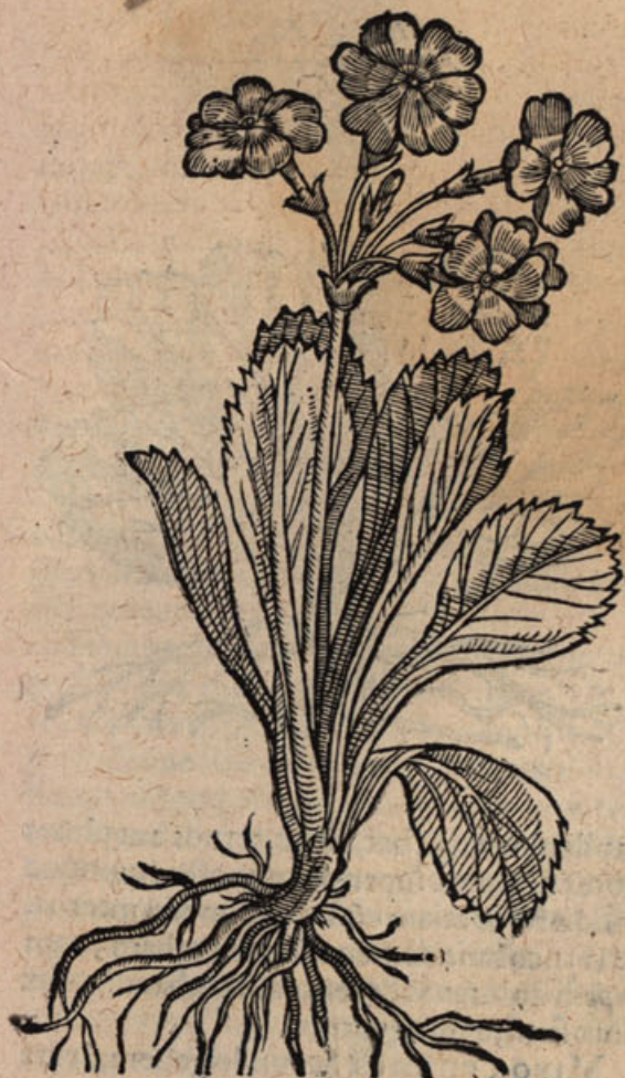
Auricula urfi II.

ALTERIVS folia breviora sunt, extremâ parte latiora plerumque, & initio quasi rotunda, quæ temporis successu angustiora circa radicem fiût, crassa quidem illa, sed minus quàm superioris, in ambitu ferrata, supernè viridia & lævia, infernè ex viridi palleſcentia: inter quæ vel ad quorum latus exeunt nudi, duas uncias longi, aut paulò ampliores cauliculi, quibus infidèt seni, octoni, aut plures flores, simul in caput aut umbellam congesti ut in superiore, illisque formâ similes, sed majores, rubro colore nitentes, obscuriore tamen initio, quasi mororum succo infecti essent, deinde eleganti & dilucidâ rubràque purpura gratissimi, intus circa umbilicum pallentes & exalbidi, odorati quidem illi, sed minus superioribus: semen in capitulis longè minoribus, parvum, nigrum, inæquale: radix priori similis.