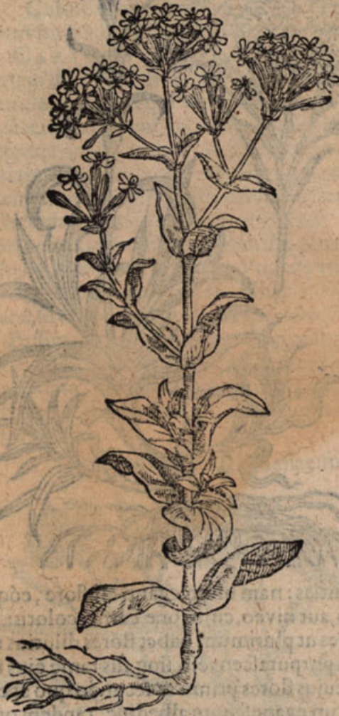
Lychnis silvestris I.