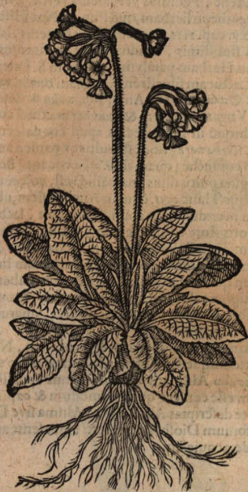
Primula veris pallido flore elatior.