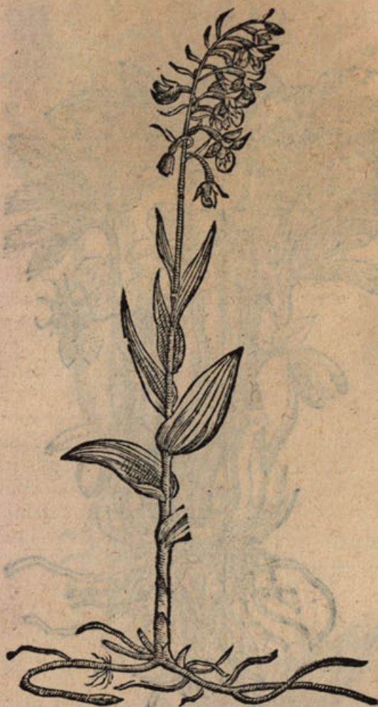
Elleborine recentior VI.