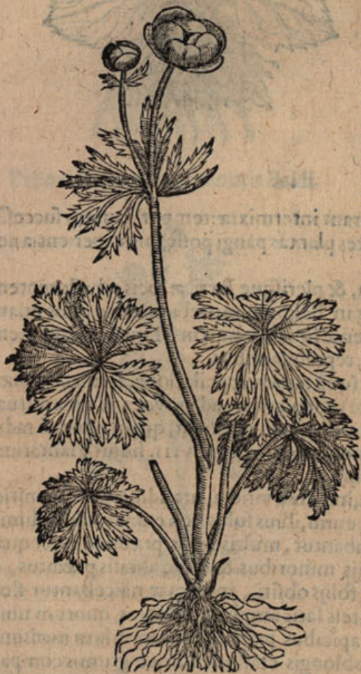
Ranunculus glomerato flore.

RANUNCULI porro illius, quem Gesnerus in Descriptione montis fracti Trollium florem vulgo dici scribit, quique à Dodonæo Ranunculus globoflo appellatur, & Quintus est inter externos ab ipso Pemptadis tertiâ lib. IIII. cap. III. flore in globum collecto, descriptos, duo in Austriacarum Stiriacarumque alpium pratis observabam genera: Majus unum, ampliore flore, & quasi aureo: Alterum, humilium, flore paullo minore, & colore, ut plurimum, ex viridi pallente: aliâs, foliorum formâ, capitulis, semine nigro, & radice inter se conveniebant. Illum etiam inter primulas veris rubro flore præditas, ex septentrionalibus Angliæ montibus erutum recenter Londini anno octuagesimo primo supra millesimû & quingentesimum cõspiciebam.