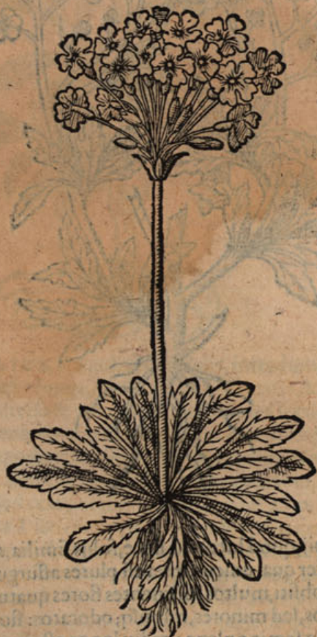
Primula veris rubro flore.