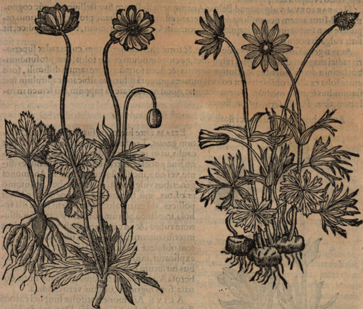
Anem. hortens. latif. simpl. flore III.

ALIAM latifoliam Anemonem ad me anno M. D. XXCVIII. mittebat N. V. Ioannes Hogelandius, quæ prima folia promebat jam dictæ ferè proxima, purpurascens ex viridi coloris, deinde aliquot alia nonnihil laciniata, inter quæ palmaris unus aut alter caulis prodibat, sustinens folium magnis & profundis lacinijs divisum, è quo assurgebat pedalis interdum pediculus, cui insidebat singularis flos duplici foliorum serie constans, quorum externa sex aut septem, orbiculato erant mucrone, nonnulla etiam dentato, foris pallida & tenuibus quibusdam purpurascens venulis quodammodo aspersa, interna autem decem, duodecim, aut plura paullo angustiora, foris etiam pallebant, omnia verò internâ parte flava erât: ex illo porrò folio cauli summo imminente plerumque nascebatur alter ramus dodrantem pedis altus, quem medium ambiebat aliud folium minus, minoribusq; lacinijs præditum, ferens etiam in summo florem similem: medium florem occupabat capitulû multis luteis staminibus cinctum, quod maturitate in semen planum lanuginosum abibat, & levis auræ flatu discutiebatur: radix infra minimi digiti crassitudinem, binas uncias longa, in profundum tendebat, non in latum se spargebat, unamq; aut alteram, interdum etiam plures teretes appendices è lateribus promebat, & aliquot insuper fibris prædita erat. Serius alijs Anemones generibus & germinabat & florebat, semen lunio maturum.