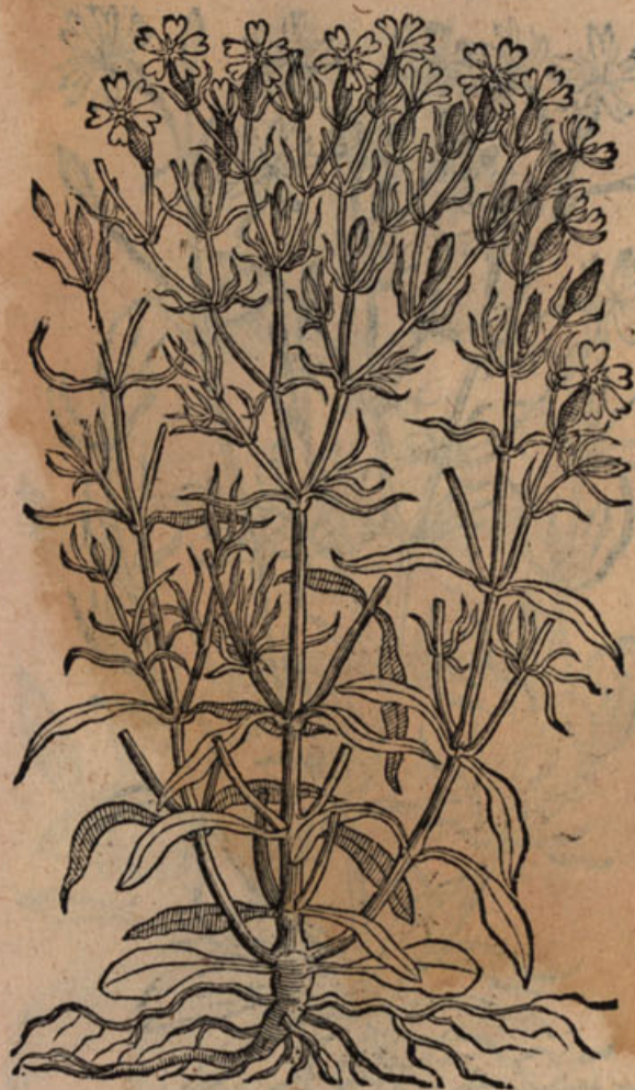
Lychnis filvestr. III.