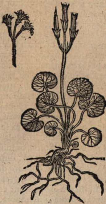
Viola montana I.