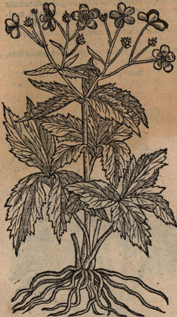
Ranunculus pleno flore albo.