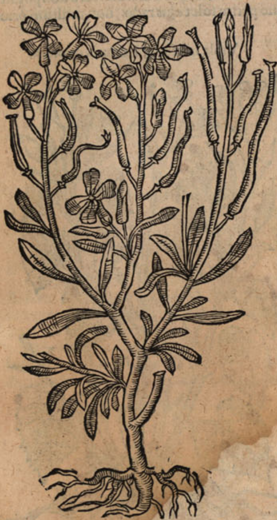
Leucoium marinum minus.