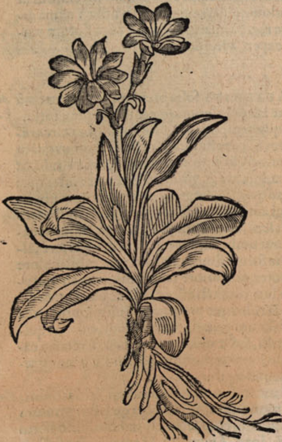
Auricula urfi vi.