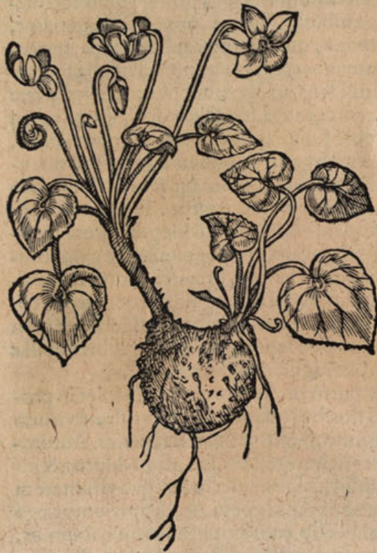
Cyclam. odo- rato flore II.