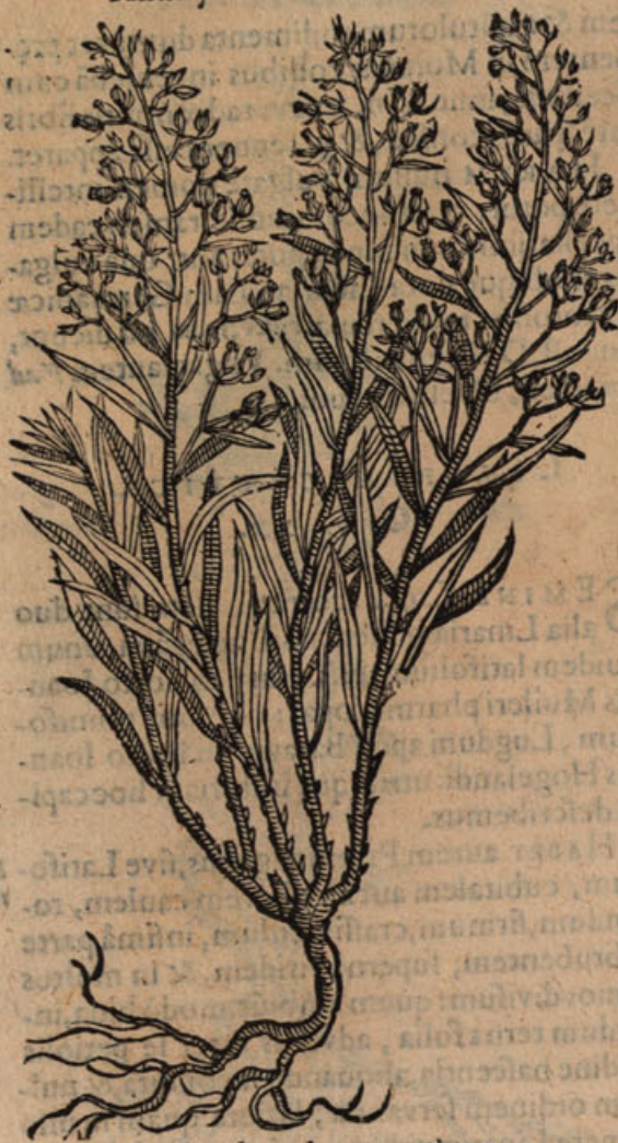
Polygala vulgaris major 1.