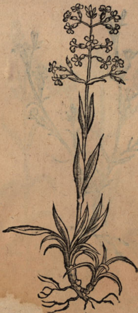
Lychnis filvestr. IIII.