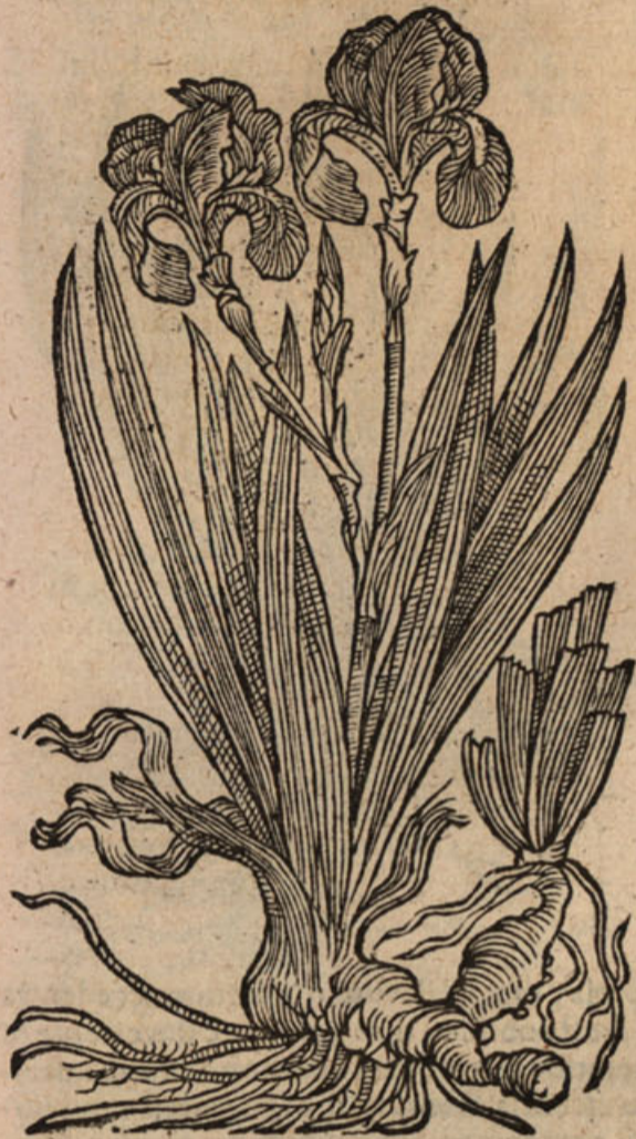
Iris latifol. major v.

QVINTA habet folia Secundæ similia, paulò tamen breviora, & angustiora. inter quæ exit caulis cubitalis, rotundus, digitalis crassitudinis, in aliquot ramos divisus, qui promunt è membranaceis thecis flores superiore minores, non nihil odoratos, quorum labra, sive folia ad terram inflexa, saturatoris sunt purpuræ, & infra circa unguem, quâ videlicet hirsuta illa & pallescens fimbria excurrit, varijs venis distincta: his incumbunt tria alia latiuscula bifida folia, quæ candicantes ligulas tegût: deinde è lateribus surgunt terna etiam folia, eleganti purpureo colore prædita, flori Lusitanicæ bifloræ ferè similia, latiora tamen: succedunt triangulares siliquæ obtuso mucrone, in quibus semen inæquale: radix tuberosa, Secundæ similis.