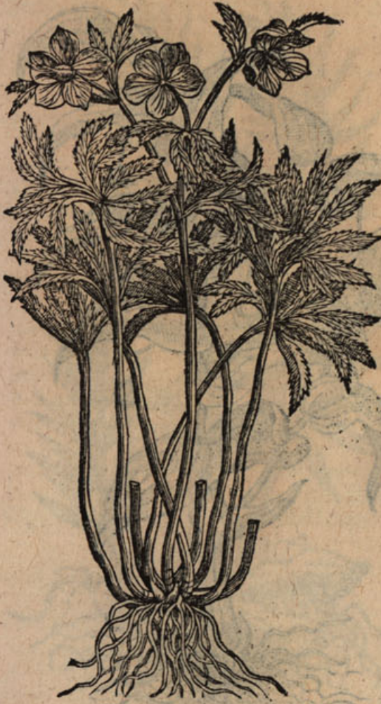
Polygonatum latifolium. t.