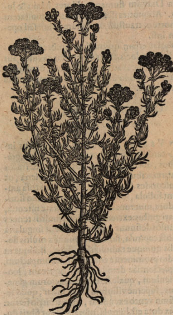
Chrysocome i. vulgaris.