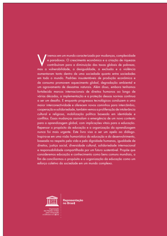
Fig. 2 - Contracapa do livro Repensar a Educação: Rumo a um bem comum mundial?.

De facto, repensar o propósito da educação e a organização da aprendizagem nunca foi tão urgente! De igual modo, só depois de qualificar a educação e o conhecimento como bens comuns mundiais e de conciliar o propósito e a organização da educação como um esforço coletivo da sociedade, se poderá orientar para o respeito pela vida, dignidade humana, igualdade de direitos, justiça social, diversidade cultural, solidariedade internacional e responsabilidade compartilhada por um futuro sustentável (fig. 2).