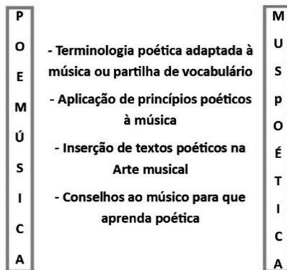
Fig. 2 – Formas de relacionamento entre a música e a poética nos tratados portugueses.

Como constatámos, desde o Tractado de Cãto Llano de Mateus de Aranda em 1533 até ao final do século XIX, os autores portugueses de Artes musicais incluíram aspetos da poética nas respetivas obras teóricas. Estes lugares de cruzamento entre ambas revelam-se ainda assim circunscritos, já que das 141 obras publicadas entre os séculos XVI e XIX, apenas 14 estabelecem paralelismos, fazem referências, integram ou apropriam-se