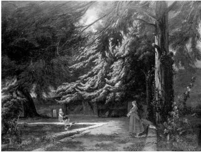
Fig. 1. Fonte dos Amores, Quinta das Lágrimas. João Cristino da Silva, c. 1871. Óleo s/ tela, A.75 x L.100 cm. Inv. 78 | Museu do Chiado – Museu Nacional de Arte Contemporânea, Lisboa