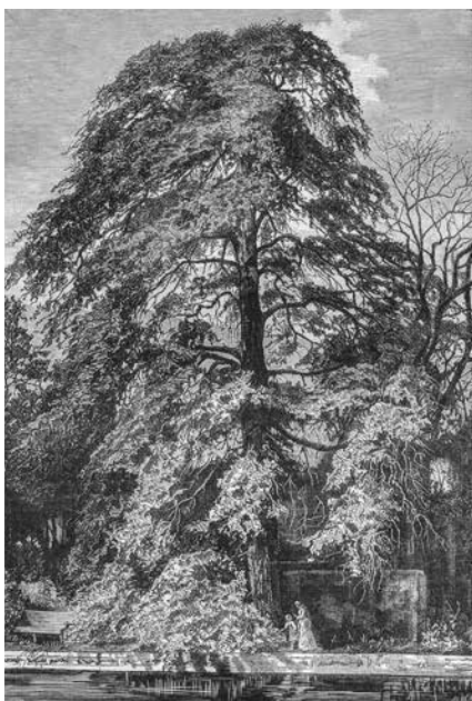
Fig. 9 Coimbra – Cedro secular na Fonte dos Amores. Desenho de Manuel de Macedo a partir de uma fotografia de Carlos Relvas.

O próprio Carlos Relvas também fotografou a fonte (Fig. 7), oferecendo-nos uma vista de pormenor que O Occidente deu à estampa numa edição de 1880 (Fig. 8). Não sem lhe acrescentar um apontamento de costumes, muito ao gosto romântico, mediante a colocação da figura feminina que, voltada para a fonte, lê um jornal. Conhecemos-lhe ainda outra fotografia, a partir de um desenho de Manuel de Macedo, publicado no ano seguinte na mesma revista (Fig. 9). Enquadrando totalmente um dos cedros seculares da Quinta das