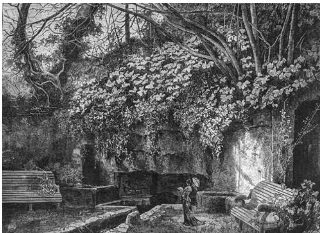
Fig. 8. A Fonte dos Amores na Quinta das Lágrimas em Coimbra. Gravura realizada a partir de uma fotografia de Carlos Relvas, 1880.