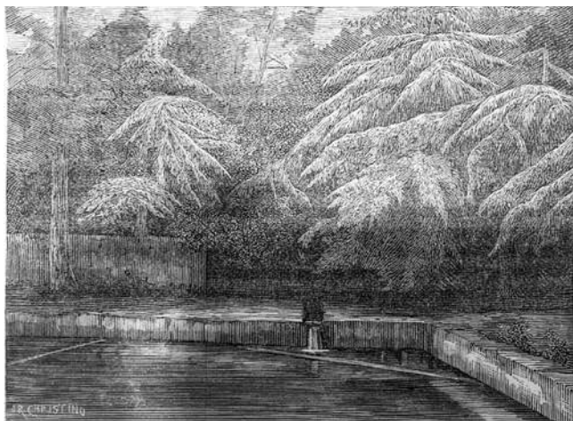
Fig. 5. Fonte das Lágrimas (Coimbra). Gravura de João Ribeiro Cristino da Silva. © A Arte 1880: 100

prido preto, capa e chapéu à Rubens, enquanto a mulher enverga um vestido de saia vermelha e xaile branco pelos ombros. Senhora de uma elegância que recorda a Viscondessa de Meneses, no conhecido retrato em que posa para o marido, figura da geração do pai Cristino. Todos estes aspetos tornam evidente o anacronismo da composição.