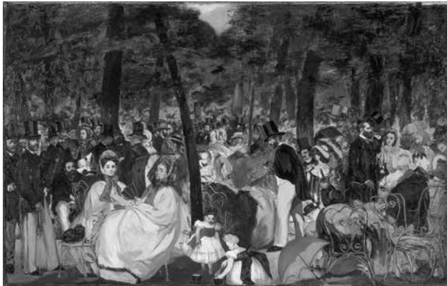
Fig. 2. La Musique aux Tuileries. Édouard Manet, 1862. Óleo s/ tela, A.76,2 x L.118,1 cm. Inv. NG3260 | The National Gallery, Londres © The National Gallery

sombria, de arvoredo cerrado, interrompido pela abertura na copa de um cedro, projetando uma luz cenográfica que ilumina as crianças e a extremidade do tanque. Junto ao imponente tronco da pinácea, o pintor concentra as anotações de tons quentes, não só as flores como o vestido carmim da mulher, em diálogo com os amarelos das ramagens e da mancha de erva fúlvida; e com as próprias crianças, sobretudo a menina, versão solar da mãe sombria.