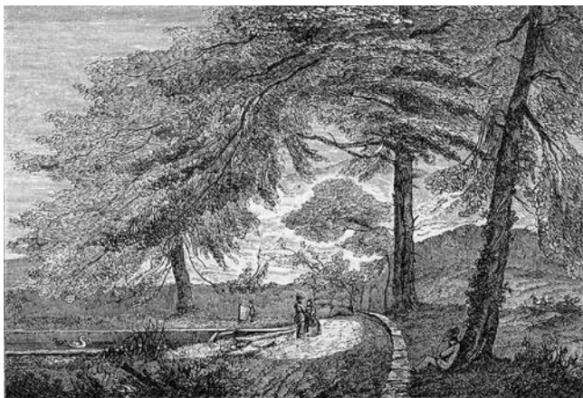
Fig. 3. Fonte dos Amores. Desenho de João Cris- tino da Silva, gravura de João Pedroso.

104). Em Fonte dos Amores , a associação ao romance folhetinesco é-nos sugerida pela evidência material do próprio jornal, que a mulher terá lido, destacando uma das folhas.