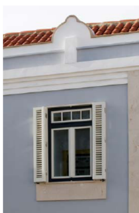
Fig.2 - Pormenor Fachada Principal

para acertar os pormenores de execução necessários a uma obra que incluía paredes com um peso até 2000kg/m 3 assentes em vigas de betão. Com vontade e união de todos os intervenientes (projectistas, técnicos e políticos responsáveis) foi possível vencer os obstáculos e os resultados finais estão à vista.