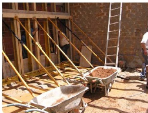
Fig.5 - Execução das paredes de taipa (Vera Schmidberger – 2008)

O Projecto previa duas paredes em taipa com 50 cm de espessura, totalizando cerca de 36m 2 . Significava isto, que eram necessários 50 metros cúbicos de terra solta para compactar.