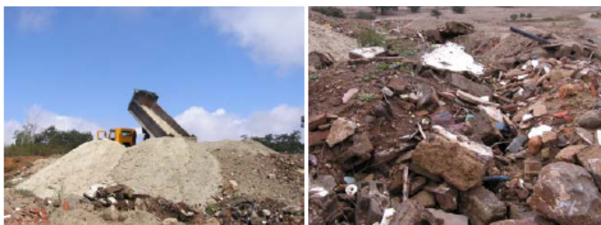
Fig. 3 - Demolições (Vera Schmidberger - 2008)

Durante as demolições foi possível verificar uma pré-existência de paredes em taipa. A chaminé e algumas paredes interiores tinham sido executadas em "tijolo burro" artesanal. Como o vazadouro da Câmara