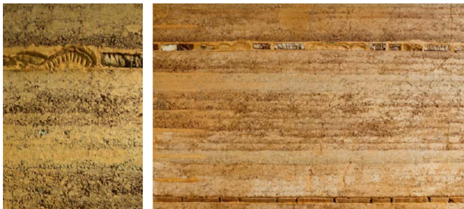
Fig. 6. Pormenores da parede de taipa

como colheres de pedreiro, martelos ou cunhas de madeira.