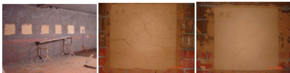
Fig.4 - Testes para determinar a composição das argamassas (Vera Schmidberger – 2008)

Visto não haver disponíveis em Portugal misturas de argamassas para pastas de terra, foi necessário um apoio técnico mais intenso por parte dos projectistas, para elaborar todas as séries de testes em obra.