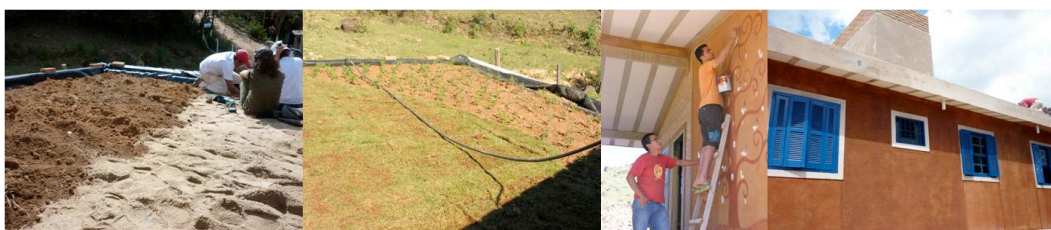
Fig. 5. Início do teto verde e sua conclusão, assim como a finalização da pintura à base de terra (GEAHAS, 2009)

de pintura da unidade de habitação, confeccionado à base de terra. A figura 5 mostra imagens da colocação do teto verde vivo e da finalização da pintura da Casa de Apoio.