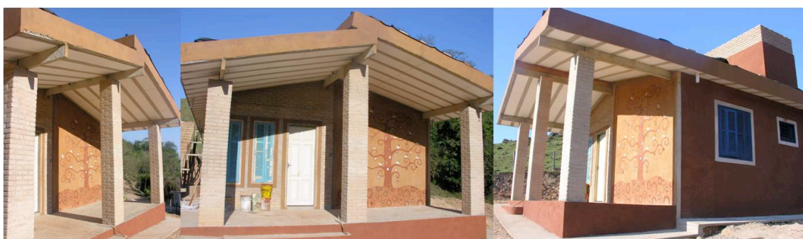
Fig. 6. Casa de Apoio concluída

Mesmo que tenham ocorrido algumas dificuldades, houve também importantes ganhos e a Casa de Apoio do Projeto CRESCER se transforma, paulatinamente, em uma referência de construção sustentável não só para os residentes do PEVI ou para as universidades parceiras, mas também para a região onde está implantada. Tal unidade de habitação vem atraindo a atenção de diversos segmentos, de clubes de serviços e membros da sociedade que, sensibilizados pela causa em benefício do PEVI, reconhecem a importância das práticas sustentáveis que se consolidaram dentro da entidade. Recentemente, um grupo vinculado à Maçonaria, assim como um grupo de pessoas do Rotary Club Centro, doou ao PEVI mais duas prensas para que a produção de BTC possa ser ampliada.