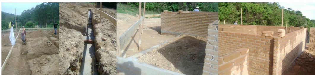
Fig. 1. A Casa de Apoio do Projeto CRESCER começa a tomar forma: a locação, a fundação (sapata corrida em concreto) e a alvenaria de BTC

Com a decisão consciente da equipe técnica aliada ao incentivo da diretoria do PEVI, a unidade de habitação foi construída desde o início com três dormitórios, um banheiro, sala/cozinha integradas, varanda frontal e varanda de serviços totalizando 91,40 m 2 . Nas imagens da figura 2, observa-se a planta inicialmente proposta e a planta