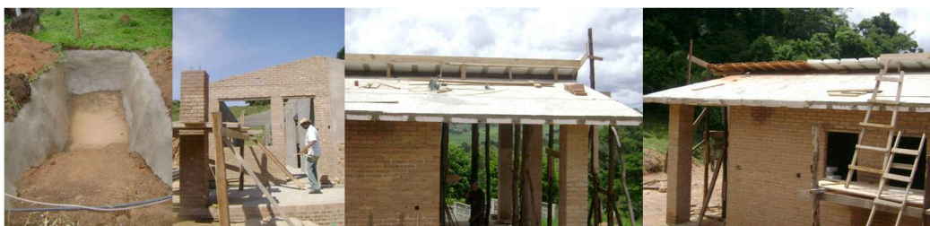
Fig. 4. Construção do tanque de evapotranspiração para o tratamento do esgoto, alvenaria e lajes cerâmica e com EPS concretadas (GEAHAS,2009)

Como havia sido estabelecido preliminarmente, estabeleceram-se contatos com um fornecedor de uma resina impermeabilizante fabricada a partir do óleo de mamona ( Ricinus communis L.) que seria utilizada para a impermeabilização das lajes e preparação da cobertura para a posterior colocação do teto verde. Ainda que houvesse interesse na implantação de uma cobertura verde leve implantada por Vecchia et al (2007) no campus da USP, em São Carlos, infelizmente não foi possível realizá-la por questões de orçamento. Assim, outros esforços foram empreendidos no sentido de viabilizar uma cobertura verde leve, porém, agregando à mesma um caráter diferencial que garantisse o comportamento pleno do sistema adotado e a possibilidade do reaproveitamento da água de chuva. Através de contato com a empresa de mantas vinílicas Reacolast,