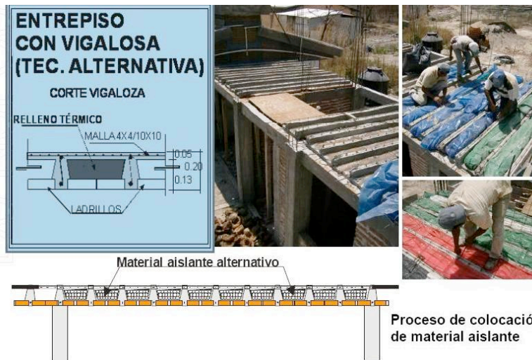
Fig. 3. Esquema da laje leve mexicana que emprega como enchimento leve casca de coco, serragem, ou resíduo de PET. Protótipo instalado no campus da Universidad Autónoma de Chiapas, México

uma unidade de habitação de interesse social construído no campus da Universidad Autónoma de Chiapas, México, que pode ser observada na figura 3.