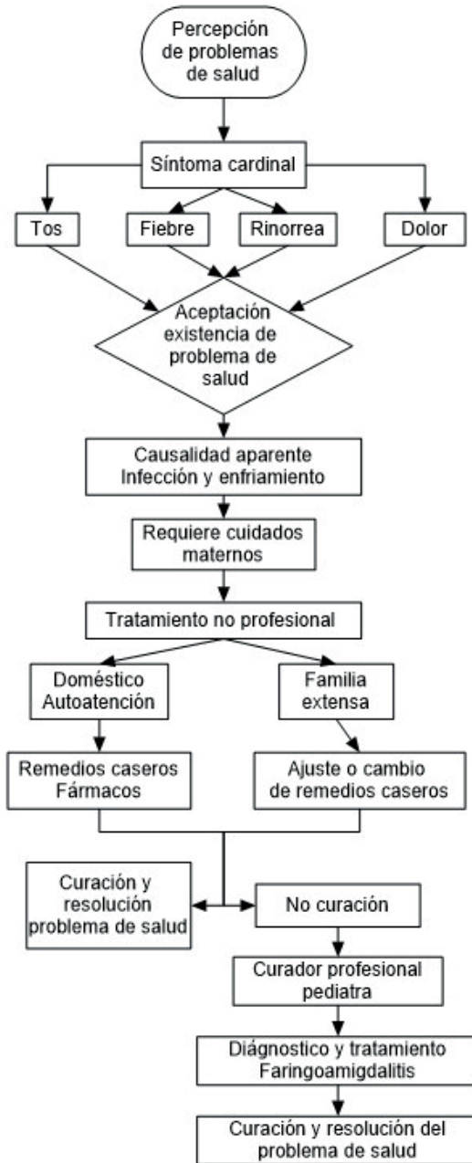
Figura 2. Estructura General de los mecanismos de atención maternos en México frente a los problemas de salud infantil.