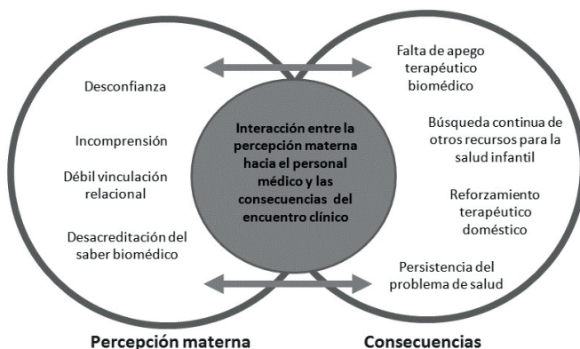
Figura 1. Percepciones y consecuencias maternas del recurso biomédico en Beijing, China.

médico, la incomprensión hacia el juicio clínico y la desacreditación del saber biomédico frente al padecimiento consultado, abarcando desde el diagnóstico establecido, el tratamiento ofertado y la resolución o curación del problema de salud, generaron como consecuencia los cuidados maternos articulados bajo estas premisas: falta del apego terapéutico recomendado por el médico, incumpliendo o suspendiendo las prescripciones farmacológicas, la búsqueda continua de otros recursos, incluyendo nuevos recursos tradicionales y terceras personas relacionadas con la madre de forma directa (a través de la autoatención brindada por otra curadora no profesional) o indirecta (solicitud de recursos terapéuticos importados o intervención para la consulta con otros profesionales recomendados). Estas consecuencias podemos considerarlas como micro adaptaciones de los cuidados maternos, resultan en interacciones de vinculación durante los subsecuentes encuentros clínicos que predisponen a la