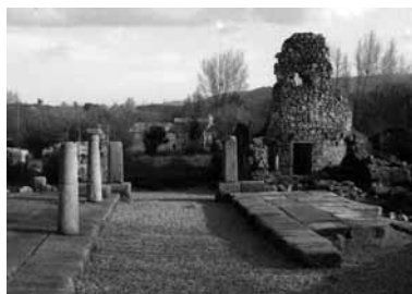
Fig.5. Vista do lado interior das ruínas da Porta Sul (S. Salvador de Aramenha).

Atendendo à complexidade de um problema que parecia definitivamente resolvido referimos o que nos parece mais significativo para uma melhor compreensão do mesmo. Duvidar da notícia transmitida pelo texto da inscrição da porta ou da certidão que transcrevemos não nos parece o