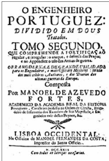
Fig.9. Portada do segundo tomo da obra O Engenheiro Portuguez .

constitui um excelente exemplo da perenidade dos modelos arquitectónicos clássicos, reinterpretados ciclicamente, tanto como forma de afirmar o poder estatal, como em versões de leitura oposta, ou que pretendem sê-lo, como sucedeu com os revolucionários franceses de 1789. O respeito por um grande passado, nomeadamente de natureza militar, aliou-se, no monumento de Castelo de Vide, à vontade de marcar tempos que se pretendiam novos, plenos de racionalidade e de conhecimento (Fig.9), naturalmente ao serviço de um rei que era, então, um César. Serve também, passados três séculos sobre a transferência do arco, numa época em que se agudiza o conflito entre valores e tecnocracia, para sublinhar a necessidade de investigar a fundo o que pode, ou não, ser verdade, tanto quanto esta nos é alcançável, sempre sob o mote Restituet omnia .