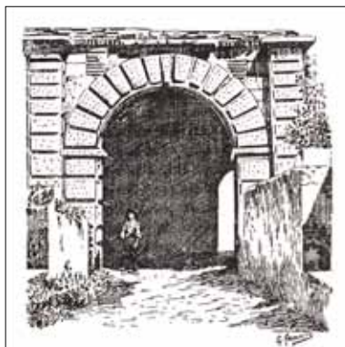
Fig.2. Pormenor da Porta da Aramenha (Gravura de Guilherme Gameiro).

Português, reproduzida por Leite de Vasconcelos (Vasconcelos 1913: 179-180). Mais tarde, em 1917, num dos primeiros artigos publicados sobre arcos romanos em Portugal, Vergílio Correia refere brevemente o arco da Porta da Aramenha, publicando a fotografia a que aludimos (Correia 1972: 224) 3 . Não há dúvidas quanto ao facto de a fotografia e de a gravura representarem o mesmo monumento, ainda que possamos admitir ter existido outra fotografia, a partir da qual teria sido executada a figura que