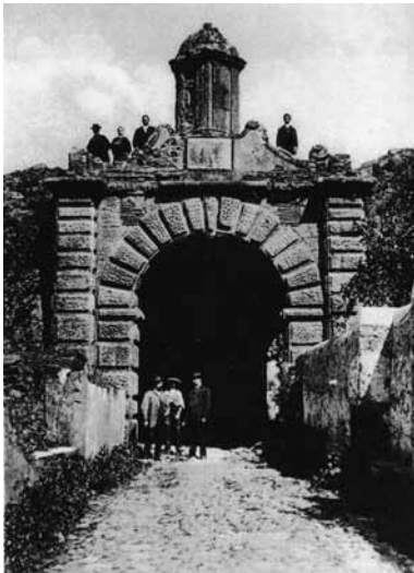
Fig.1. A Porta da Aramenha, cerca de 1890 (Segundo postal de Martins e Silva, Lisboa, 1904).

Da Porta da Aramenha, todavia, possuímos documentação iconográfica, não muito rica, mas suficiente para alimentar uma análise coerente da arquitetura do monumento e daquilo que nele