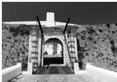
Fig.4. A Porta de Évora, na cidade de Estremoz.

aduelas de portadas construídas de raíz, no século XVIII, mesmo quando imitam vagamente obra antiga. Tomemos como exemplo a muito sóbria Porta de Évora (Fig.4), das fortificações modernas de Estremoz, contruída no início do século XVIII e que é, tipologicamente, uma das que mais se aproxima da Porta da Aramenha. Embora estejam presentes as pilastras rusticadas ladeando o arco, como em Castelo de Vide, verifica-se que