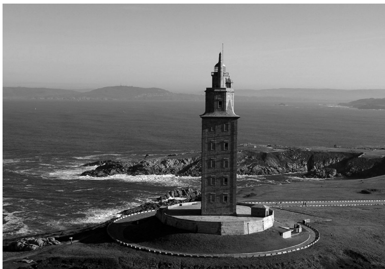
Fig. 8 – O farol romano da Corunha ( Brigantium ), restaurado no século XVIII.

Os portos romanos ( portus, positio ) dividiam-se por várias categorias, para além dos abrigos ou fundeadouros ( statio, refugium, plagiā ) que serviam pequenas povoações ou estabelecimentos privados, normalmente dotados de um equipamento sumário, quando o tinham. Grande parte dos portos peninsulares eram flúvio-marítimos, com reduzido equipamento, cais, pontões em madeira e os imprescindíveis armazéns ( horrea ). Alguns portos, sobretudo na área mediterrânica, contaram com obras defensivas mais complexas, estruturas de difícil construção na área atlântica, mas que são referidas por Estrabão na foz do Minho (Estrabão 3.3.4), e que existiram noutros locais, como Brigantium e Balsa , cidade nas cercanias de Tavira (Mantas 2000 36-37), estruturas recentemente identificadas no importante sítio de Boca do Rio, também no Algarve 5 . A navegação noturna, de longo curso, obrigou à construção de faróis, desaparecidos na maior parte, como os de Cádiz, Chipiona ou Outão, conservando-se em funcionamento a célebre Torre de Hércules, na Corunha (Fig. 8), obra de um arquiteto lusitano eminiense ( CIL II 2559 = 5639).