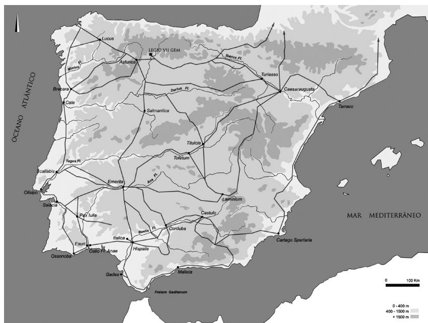
Fig. 5 – A rede viária hispânica indicada pelo Itinerário de Antonino .

edição clássica de Petrus Wesseling. O roteiro parece remontar ao século III, com interpolações mais recentes, mas utilizou material anterior, mostrando com frequência erros na indicação das distâncias, em parte resultantes das sucessivas cópias a que o original foi sujeito, sendo o manuscrito conhecido mais antigo o Escorialensis , do século VII. Embora alguns investigadores defendam a existência na Península Ibérica de medidas diferentes para a milha verifica-se que, quando é possível confirmar no terreno as indicações do Itinerário , o valor métrico da milha romana é o normal, ou seja, 1481,50 metros.