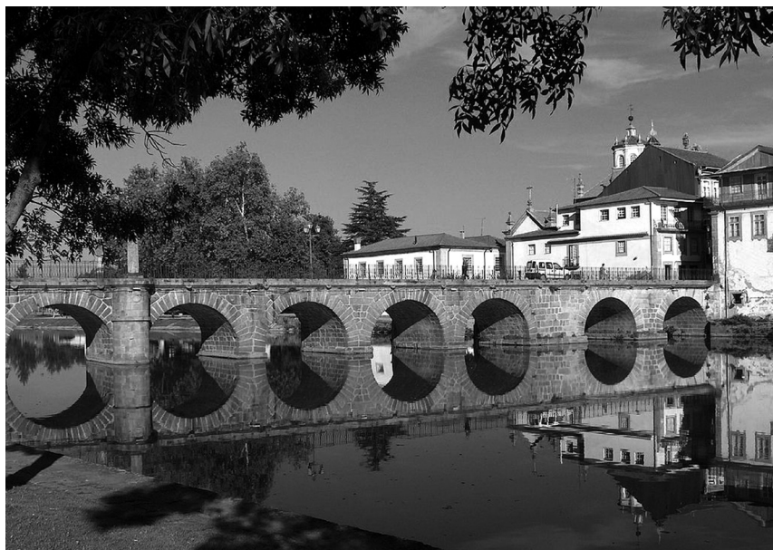
Fig. 3 – A ponte de Trajano, sobre o rio Tâmega, em Aquae Flaviae (Chaves).