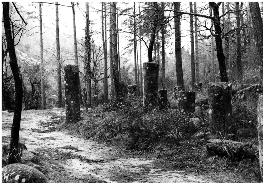
Fig. 6 – Ninho de miliários de Bico da Geira, na Via Nova , construída por Vespasiano.

Com Trajano e Adriano houve de novo intensa atividade construtora e renovadora, situação que voltamos a encontrar com Caracala. De forma um tanto surpreendente miliários de Maximino e de Décio comprovam a atenção pelas vias ao longo do século III, período no qual se notam alterações na frequência de certas estradas. No final deste século inicia-se o último período de atividade viária significativa, por iniciativa dos tetrarcas e da dinastia constantiniana, multiplicando-se entretanto os miliários honoríficos, que perturbam a interpretação, sem que esqueçamos o facto de que as cidades podem ter dedicado ao imperador a realização de trabalhos viários. Atendendo às rigorosas e reiteradas determinações do Código de Teodósio a propósito da obrigatoriedade sem isenções desses trabalhos, julgamos a hipótese muito provável. O miliário hispânico mais recente, pertencente a Teodósio e Honório (Aguilera 1985 86-89), foi achado perto de Gerona, no traçado da Via Augusta .