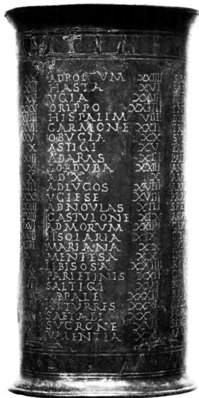
Fig. 2 – Um dos vasos de Vicarello (CIL XI 3283. Museu Nacional Romano, Roma).

epigráficos (Rodríguez Colmenero; Ferrer Sierra; Álvarez Asorey 2004). Porém, a maior parte das estradas, ainda que por vezes designadas nos miliários como viae militares , teve na época imperial funções mais pacíficas relacionadas com o quotidiano da mobilidade existente no mundo romano. A urbanização crescente das províncias hispânicas não só desenvolveu a utilização da rede viária como contribuiu para o seu alargamento, multiplicando-se as estradas secundárias e os caminhos vicinais, hoje quase sempre de difícil localização.