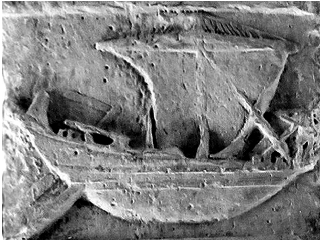
Fig. 7 – Navio tipo corbita figurado numa estela funerária (CIL II 4065) de Dertosa (Museu de Tortosa).