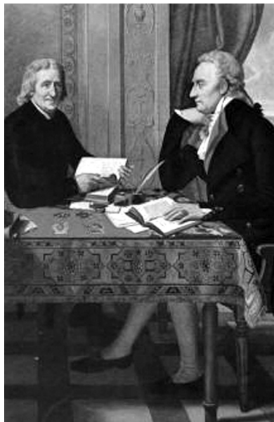
Figura 3 – Abade Tommasi Valperga e Vittorio Alfieri

Um juízo semelhante acerca das mulheres portuguesas tinha sido partilhado, aliás, pelo antigo embaixador conde de Scarnafigi o qual, já em Londres no começo de 1771, escrevera ao amigo Carlo Francesco di Masino: «Comme sûrement à l'heure qu'il est vous vous serez déjà aperçu qu'il n'y a nulle part au monde qu'en Portugal où les Femmes soient des véritables Femmes, je vous prie de ne les pas négliger et de leur rendre justice» 48 .