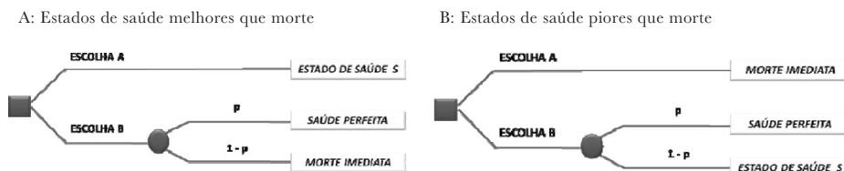
Figura 1: Jogo padrão

Para situações piores que morte (Figura 1B), no entanto, a alternativa B passa a ser entre ‘saúde perfeita’ e o estado de saúde considerado pior que morte. E esta torna-se o resultado certo correspondente à alternativa A (Ferreira et al., 2010).