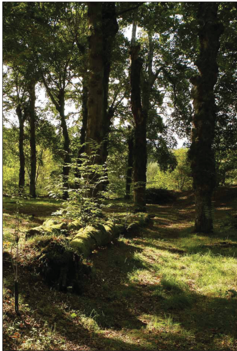
Fig. 2 - Aspecto de bosque gallego.

(fig 2),y otras, orientadas a controlar el daño que el fuego produce más allá de las pérdidas de biomasa, sobre los suelos y el agua.