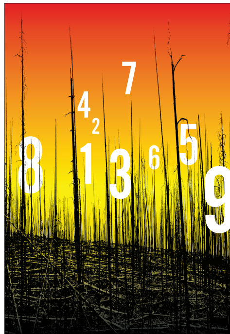
Fig. 4 - Verso de la portada del libro.