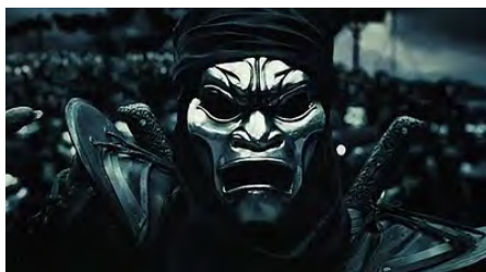
Imagem 8. O contraste entre as tropas persa e grega.

A distinção entre o comedido e o desmedido não se mostra apenas no físico. Aspectos comportamentais também endossam a diferença existente entre os dois lados da Batalha das Termópilas. Enquanto, ao longo de toda a narrativa, os persas se mostram desajeitados, sem saber como atacar e correm para cima e para baixo pelo campo de batalha, os gregos mostram-se muito bem treinados. Com seus escudos e suas lanças formam uma barreira quase impenetrável.