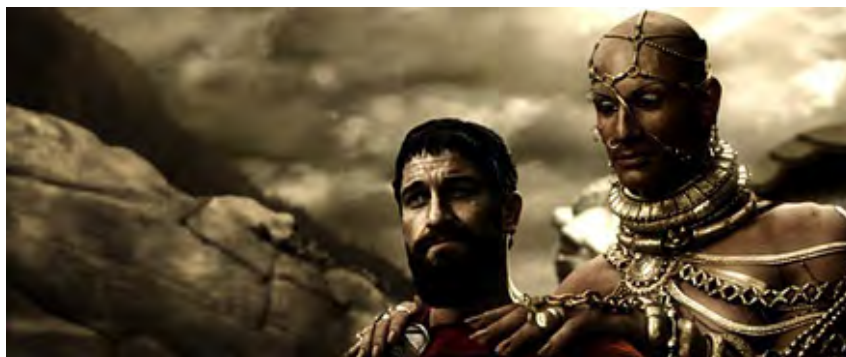
Imagem 4. Os reis Leônidas e Xerxes em cena do filme 300: equilíbrio e excesso em contraposição.

Assim, a tábua de salvação para Leônidas (Gerard Butler) parece ter sido o modo como ele exerceu seu poder, buscando, ao contrário do rei Xerxes, o equilíbrio.