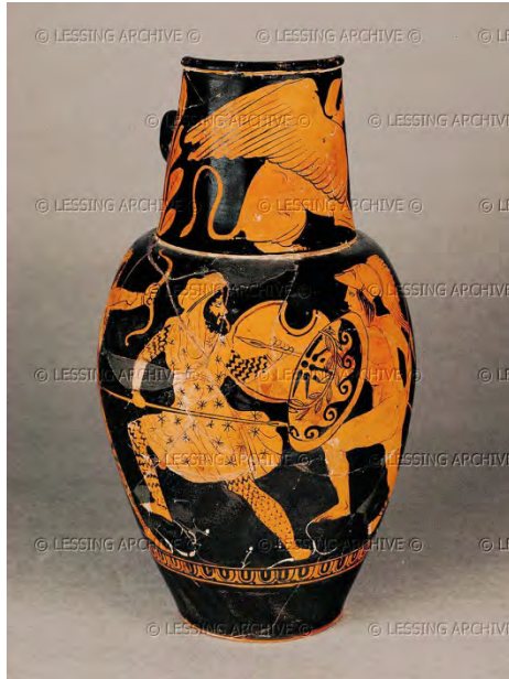
Imagem 14. Grego e persa em pintura: o inimigo não é assim tão diferente.