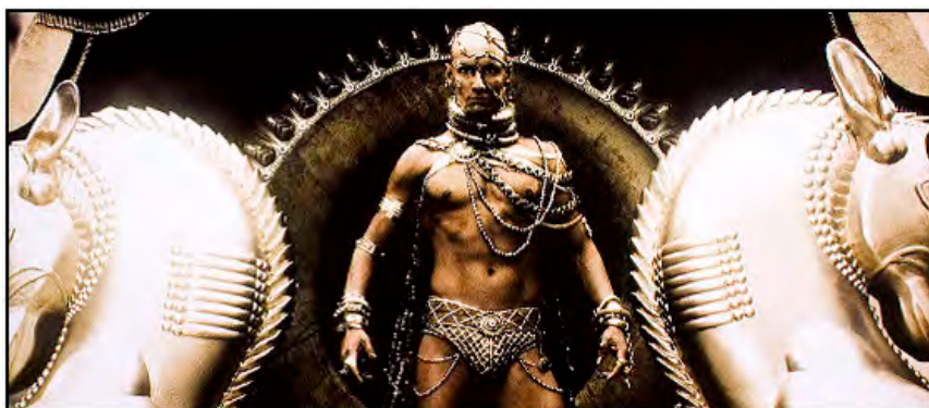
Imagem 3. O Xerxes dos cinemas.