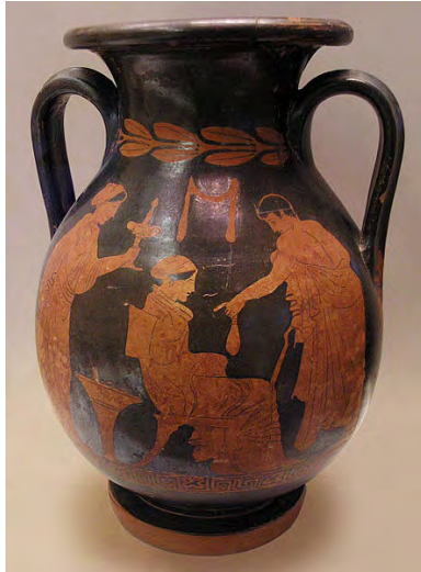
Imagem 12. Cliente entregando dinheiro a uma prostituta: a prática não era proibida na Antiguidade.

Além disso, as danças eróticas também estavam presentes na Grécia Antiga: