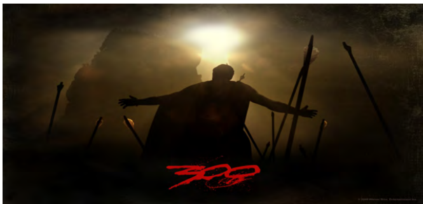
Imagem 10. Leônidas em cena que antecede sua morte: o fim de um espartano em campo de batalha é sinônimo de honra e glória.

Sua força e sua coragem são tamanhas que nenhum guerreiro persa, em combate corpo a corpo, seria capaz de derrotá-lo. Leônidas não morre pelas mãos de um homem, mas pelas flechas de um império, que encobrem o sol. Tudo isso mostra o quanto a questão imagética e visual é explorada em 300 e como ela vem carregada de simbolismos que podem acabar passando despercebidos pelo espectador.