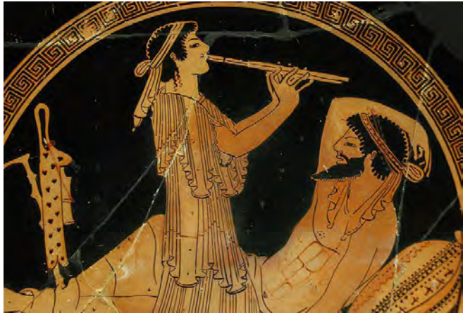
Imagem 11. Tocadora de flauta e participante de um banquete: tal tipo de divertimento era comum na Grécia Antiga.