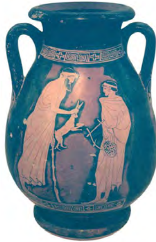
Imagem 13. Homem adulto oferecendo presente a jovem: cena com conotação pederástica.

Ou seja, apolíneo e dionisíaco andavam de mãos dadas na Antiguidade grega. O amor de um homem grego também não era dedicado única e exclusivamente a sua esposa, como relata o filme. As relações homoeróticas, incluindo a pederastia, eram naturais e a mulher, muitas vezes, exercia um papel não tão importante na vida de seu esposo.