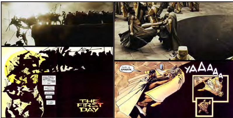
Imagem 1. Cenas do filme de Snyder e da HQ de Miller: a estética dos quadrinhos recriada para o cinema.