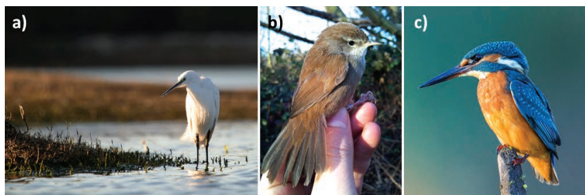
Figura 10.1. Aves associadas a ambientes aquáticos: a) garça-branca pequena Egretta garzetta , espécie comum que frequenta as zonas pouco profundas de rios no litoral, centro e sul do país; b) rouxinol-bravo ( Cettia cetti ) espécie característica da vegetação ripária em Portugal; c) guarda-rios-comum ( Alcedo atthis ), espécie carismática fluvial que ocorre em todo o país.

Existem ainda espécies residentes que fazem dos rios a sua “casa”, estabelecendo territórios ao longo destes, onde encontram facilmente suporte físico para instalar os seus ninhos e alimento disponível, seja no próprio leito ou nas suas margens. Por exemplo, as aves de grande porte como as garças (Figura 10.1a) e os colhereiros podem instalar as suas colónias ao longo do curso dos rios, nas margens do leito, em açudes ou barragens, ou em áreas de paul associadas. Mais recentemente, o íbis-preto ( Plagadis falcinellus ) iniciou a colonização no território português, em diversas áreas, sobretudo ao longo do curso do Mondego, do Tejo, do Sado e do Guadiana, acontecendo o mesmo, no caso do corvo-marinho-de-faces-brancas ( Phalacrocorax carbo ). Do mesmo modo, durante a época de reprodução, os patos, principalmente o pato-real ( Anas platyrhynchos ), utilizam as margens dos rios, onde a vegetação ribeirinha fornece refúgio para proteção de predadores, para ali nidificar e criar as proles, que conduzem para as águas após o nascimento.