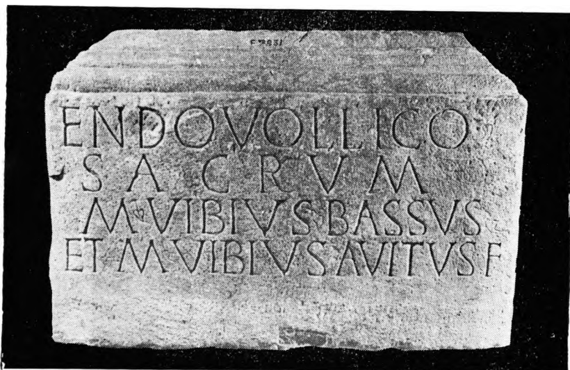
FIG. 5 —Um pedestal de estátua a Endovélico