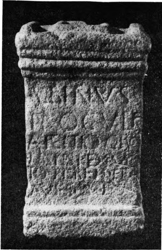
FIG. 2— Ara a Arentius Cronisensis