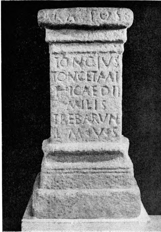
FIG. 8 — Ara a Trebaruna