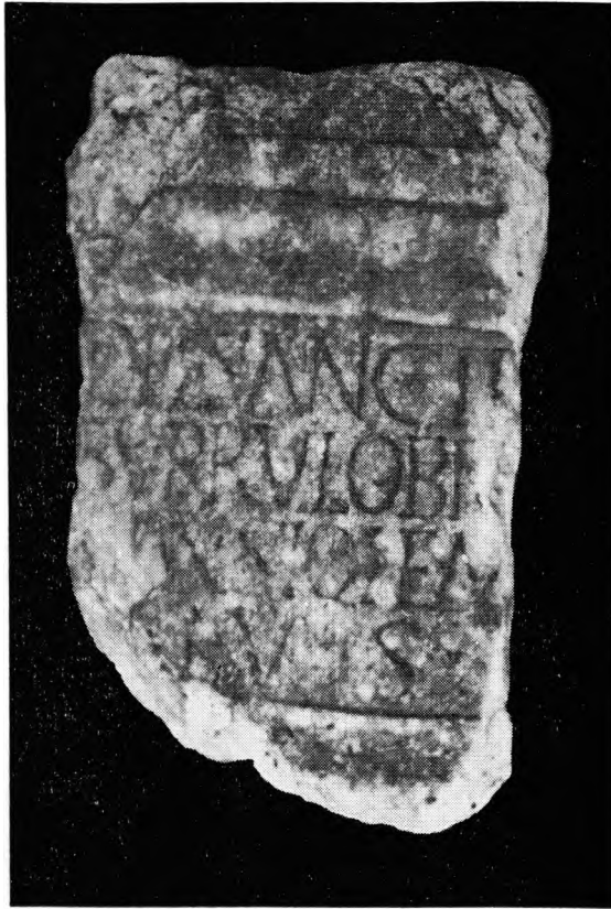
FIG. 4 — A ara à Deusa Santa Burrulobrigerse