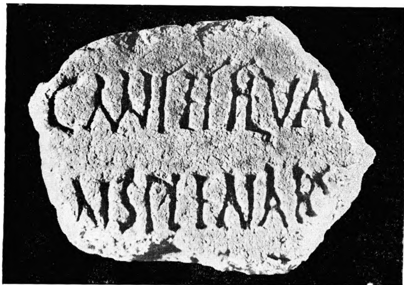
FIG. 6 — Fragmento dum eventual «cântico» a Endovélico (CIL II G333 b)