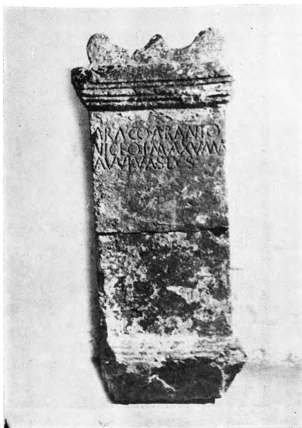
FIG. 1—Ara a Aracus Arantus Niceus

— Arentiae Equotullaicensi , honrada por Níger, filho de Arcão, em Sabugal. FE 27.