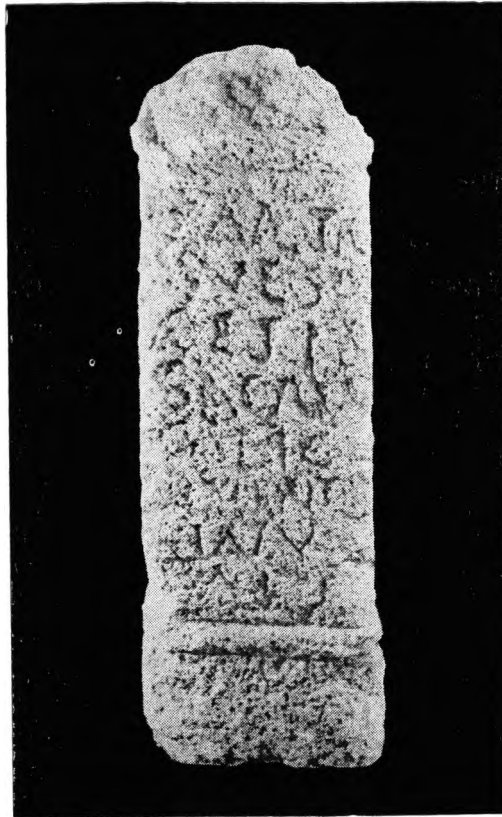
FIG. 7 — A árula a Sanctus Painesus Cesius