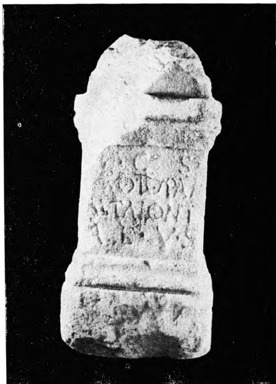
FIG. 3 — A áruia verosimilmente dedicada au deus Carneus