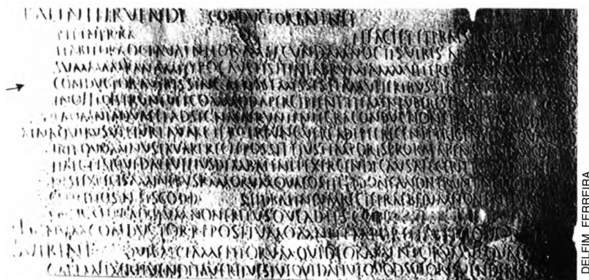
FOTO 1 - Pormenor da inscrição de Vipasca I (face não aproveitada) com a determinação aqui comentada.