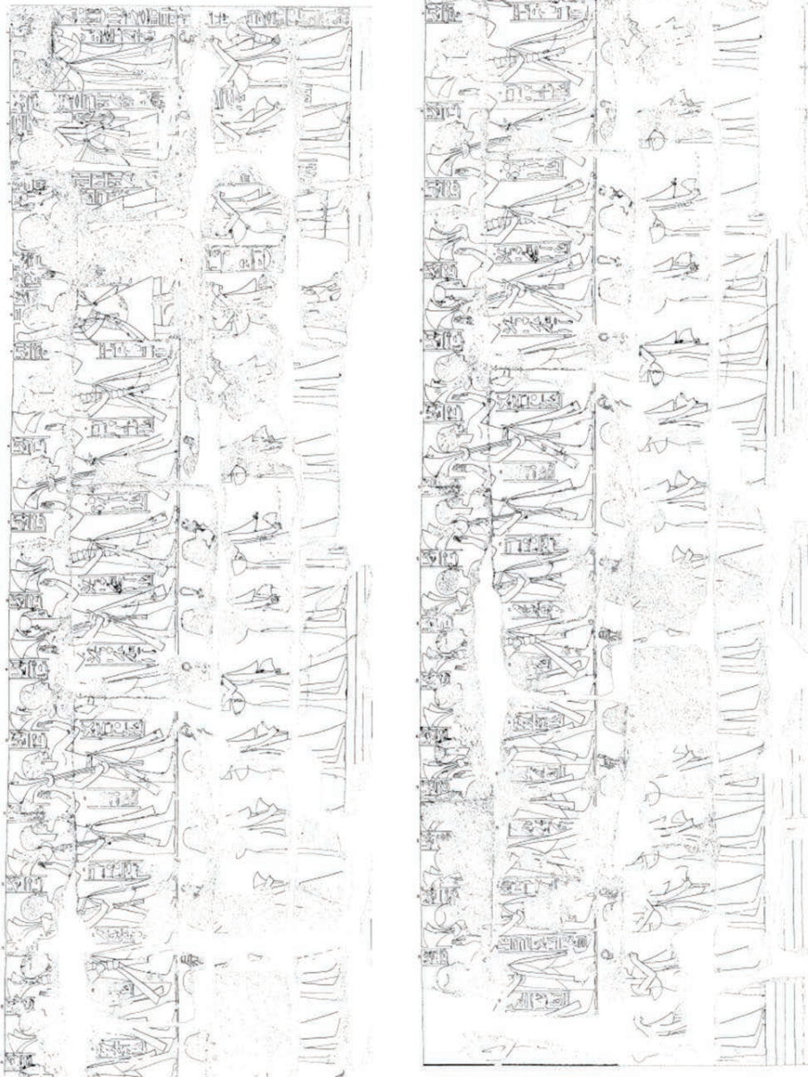
Fig. 3 – Cortejo liderado por Nedjemet (em cima à direita) dos filhos e filhas de Herihor. Pátio do Templo de Khonsu, em Karnak.