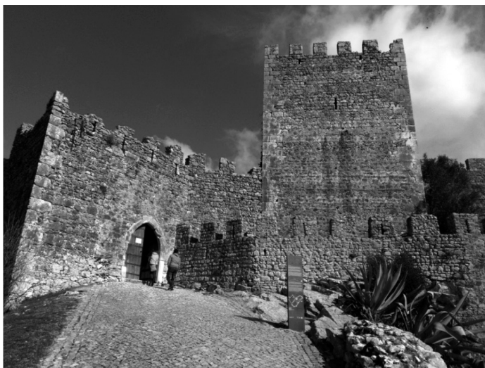
Fig. 1 – Castelo de Montemor-o-Velho: Porta do Sol e Torre das Medidas

Finalmente, estando então em fase de projeto em França um sistema de base invariável e estrutura decimal, dá especial atenção a essa novidade. Verificando o apoio, um tanto inesperado, que o novo sistema francês granjeava em Inglaterra, traduz e transcreve a maior parte de um pequeno artigo publicado no ano anterior na revista londrina Monthly Review . Esse artigo descreve o novo sistema, na versão preliminar então disponível, expressando a sua aprovação: “We venture to express our approbation of this system of measures the more freely, as it is not founded on any arbitrary standard, nor has it the least connection with national and political prejudices” 52 .