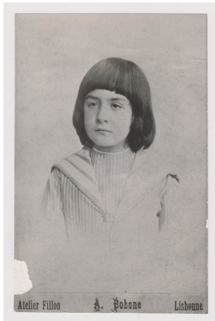
Mário de Sá-Carneiro em criança. Reprodução de um cliché A. Bobone, adquirido recentemente (2016) com a primeira edição de “Céu em fogo”.

Encontrados por nós numa caixa sem qualquer identificação, ainda hoje não sabemos como deram entrada nesta Biblioteca 3 . São poucos (ver adiante), livros de estudo, de literatura infantil e menos infantil, o que condiz com a hipótese de serem parte dos que ficaram em Portugal, quando Mário foi para Paris.