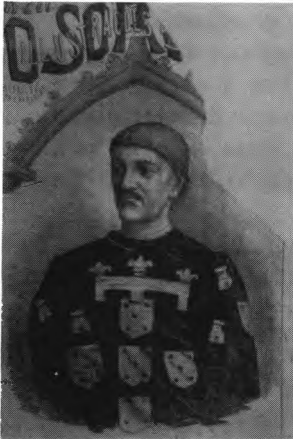
O Infante D. Henrique visto pelo jornal satírico O Sorvete .