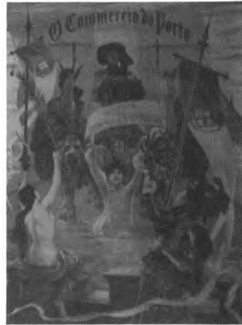
Número comemorativo do jornal O Commercio do Porto