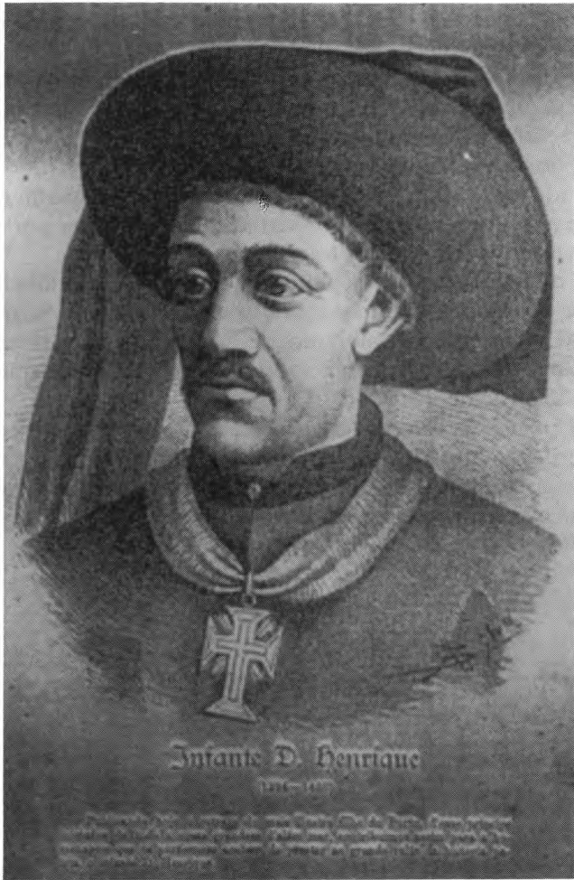
O retrato do Infante - 1894