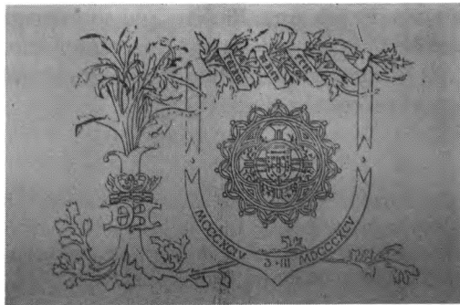
A bandeira do Centenário