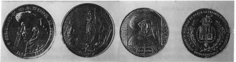
As medalhas comemorativas