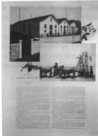
Exposição Agrícola e Industrial em Vila Nova de Gaia