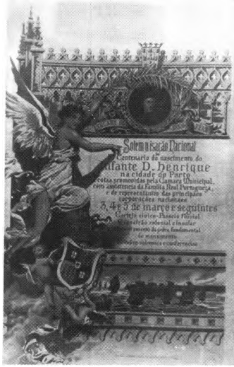
Cartaz do Centenário