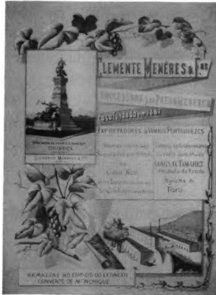
O aproveitamento mercantil do Centenário — o anúncio comercial