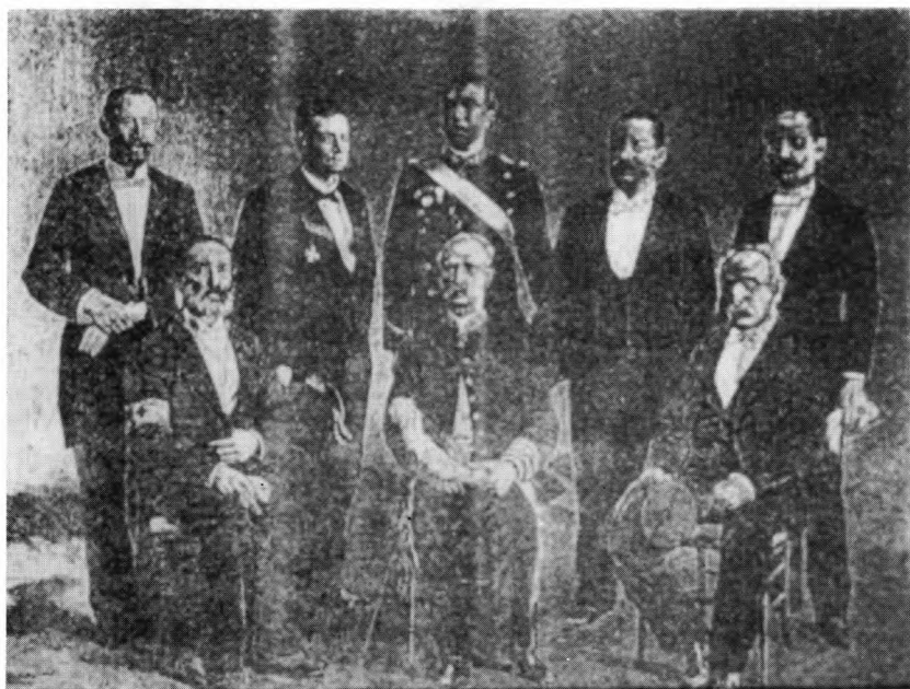
A Comissão Executiva das comemorações henriquinas.