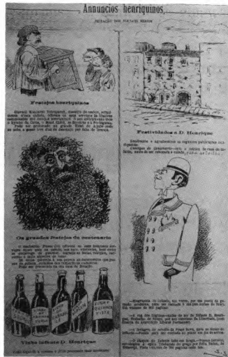
A caricatura — um sugestivo meio de propaganda