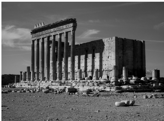
Figura 10 – Colunata e fachada oriental do templo de Bel, em 2010

Este edifício tem um lugar especial na história da arquitectura do Império, a qual exige com frequência, sobretudo no Oriente, uma razoável flexibilidade interpretativa. O desconforto sentido por Wheeler, para quem a possibilidade de vir a acontecer uma tragédia em Palmira parecia algo impensável, soa vagamente premonitória do que, afinal, sucedeu. A destruição foi eficiente, apenas sobrevivendo o portal adossada à colunata da fachada (Fig.11). Na verdade, parece-me praticamente impossível qualquer restauro coerente do templo. Assim, um monumento que não tinha há muito qualquer significado religioso e que apenas podia recordar um passado de prosperidade vivido na região, foi destruído por quem pretende apagar a história, por contraste demasiadamente incómoda para os seus propósitos.