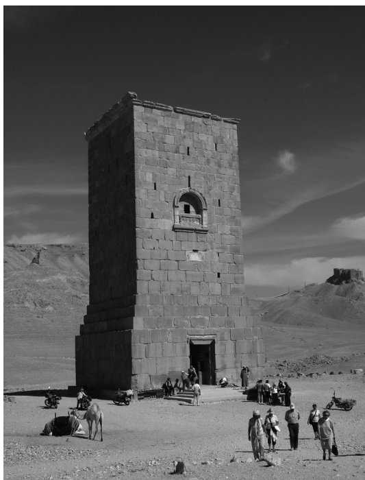
Figura 12 – A torre funerária de Elahbel (103 d.C.), em 2010.

Túmulos (Fig.12), na periferia da cidade, por onde Volney passou antes de entrar nas ruínas. Seis dessas torres, entre as quais as de Elahbel, Jamlishu, Atenatan e Khitot, as mais imponentes, foram destruídas com explosivos, aniquiladas. Eram excelentes construções, com vários andares, que funcionavam como grandes mausoléus ou columbários familiares dos notáveis de Palmira 61 , construídas entre o século I e o século II, a última datada de 128. Pertencem, portanto, a um período de grande desenvolvimento económico da cidade, que se reflectia no autoelogio dos notáveis. Muito ornadas no interior e com os nichos funerários enobrecidos por retratos dos defuntos em baixo-relevo, conservavam, como no caso do elaborado tecto da Torre de Elahbel, a pintura que enriquecia a decoração, constituindo um dos raros exemplos conservados da policromia arquitectónica antiga (Fig.13).