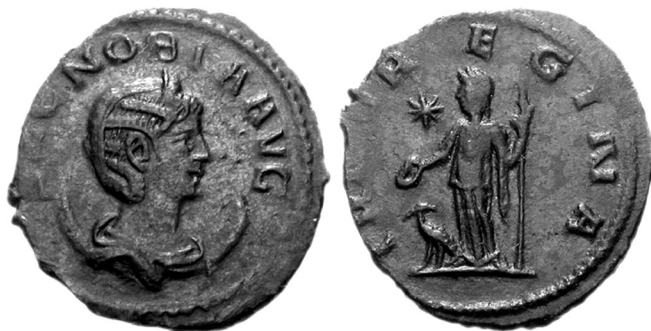
Figura 5 – Antoniano de Zenóbia, com o título de Augusta e uma muito romana Iuno Regina no reverso (RIC V 2: 3122).

A conclusão lógica desta evolução, depois do assassinio de Odenato em 267, foi a eclosão do chamado Império de Palmira, sob o governo de Júlia Aurélia Zenóbia, segunda esposa de Odenato, pretextando tutelar o filho menor, Vabalato. Os historiadores dividem-se na apreciação dos cerca de 12 anos que durou a governação de grande parte do Oriente, incluindo o Egipto, por Zenóbia. Uma parte dos especialistas interpreta a secessão, que só se confirma depois de 271, quando Zenóbia ( Bat-Zabbai ) adopta o título de Augusta (Fig.5), circunstância que, conjugada com a conquista da Arábia e do Egipto implicava uma ruptura definitiva com Roma 33 . Inicialmente, todavia, não houve quebra da política de dependência formal seguida por Odenato. Creio que este problema deve ter em conta a situação caótica do Império Romano na época, roído por usurpações e divisões territoriais que, vistas no Oriente, só podiam facilitar a tarefa dos rivais iranianos, convidando-os a uma desforra.