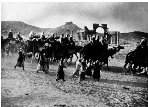
Figura 14 – Um grupo supletivo meharista atravessa as ruínas da cidade nos anos 20 do século passado.

Opto firmemente pela primeira possibilidade 84 .