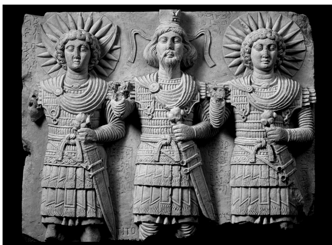
Figura 2 – Malakbel, Aglibol e Baal Shamin num baixo-relevo de Palmira (Museu do Louvre, Paris).

religioso semita de características astrais, difundido na região levantina síro-fenícia e que, entre outros locais de culto dotados de grandes santuários se destacam Palmira e Baalbek ( Heliopolis ), este no Líbano 9 . Alguns destes santuários contribuíram, através do imaginário religioso neles cultivado, para inspirar conceitos sociopolíticos que encontraram forte expressão através das utopias solares que marcaram o mundo helenístico e romano, sobretudo nos séculos III e II a.C., passando da literatura e da filosofia ao campo das aplicações políticas, nem sempre com bons resultados 10 .