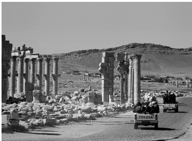
Figura 3 – Forças governamentais sírias passam junto ao arco honorífico destruído pelos jihadistas.

A eficiência dos demolidores, sobretudo no caso dos templos, é de sublinhar, o que confirma a presença de especialistas em demolição, provavelmente militares. Perante o que se vê no terreno, e as imagens de satélite já o haviam sugerido, o templo de Baal Shamin e o templo de Bel encontram-se totalmente destruídos, arrasados, o que levanta sérias dúvidas quanto a uma muito rapidamente propalada vontade de reconstruir os templos e o arco honorífico num prazo de cinco anos. Não creio que tal seja possível, com exceção do arco, de que grande parte da cantaria subsiste, permitindo uma anástilose eficiente. É certo que existe muita documentação sobre os templos, o que facilita uma reconstrução que, na maior parte consistirá em levantar uma cópia do edifício perdido, com recuperação de um ou outro elemento arquitectónico 12 . Talvez o reconhecimento das dificuldades em presença tenha levado a desviar a atenção para o arco honorífico, inclusive através das réplicas de uma pequena parte dele, em escala inferior à real, levantado em Londres 13 , pouco ou nada se divulgando sobre os restantes