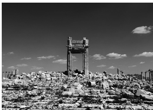
Figura 11 – Estado actual do templo de Bel, destruído em 2015.

Este edifício tem um lugar especial na história da arquitectura do Império, a qual exige com frequência, sobretudo no Oriente, uma razoável flexibilidade interpretativa. O desconforto sentido por Wheeler, para quem a possibilidade de vir a acontecer uma tragédia em Palmira parecia algo impensável, soa vagamente premonitória do que, afinal, sucedeu. A destruição foi eficiente, apenas sobrevivendo o portal adossada à colunata da fachada (Fig.11). Na verdade, parece-me praticamente impossível qualquer restauro coerente do templo. Assim, um monumento que não tinha há muito qualquer significado religioso e que apenas podia recordar um passado de prosperidade vivido na região, foi destruído por quem pretende apagar a história, por contraste demasiadamente incómoda para os seus propósitos.