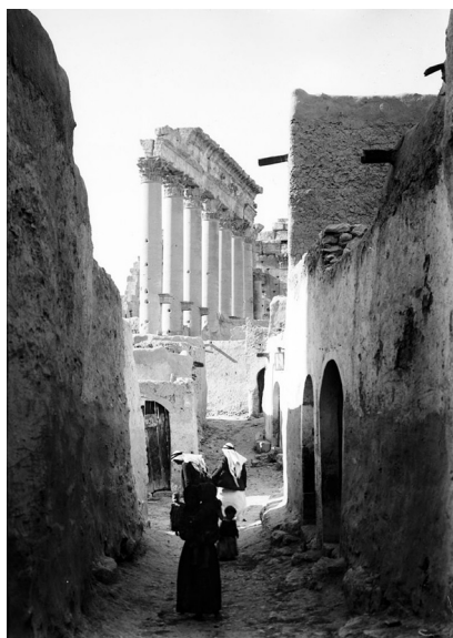
Figura 6 – A aldeia de Tadmor e o templo de Bel no início do século XX. Dois mundos distintos e opostos.

As primeiras escavações científicas efectuadas em Palmira tiveram lugar em 1902 e em 1917, sob orientação dos alemães Otto Puchstein e Theodor Wiegand 42 , continuadas pelo francês Henri Seyrig a partir de 1929. Com algumas interrupções episódicas, nomeadamente durante a década de 40 do século passado, as escavações arqueológicas e o estudo e publicação dos achados provenientes da cidade continuou a bom ritmo 43 , ainda que grande parte da área urbana, muito vasta, continue por escavar, pouco se conhecendo das zonas habitacionais, uma vez que foi dada prioridade à zona monumental e aos grandes edifícios públicos, religiosos e profanos, assim como a parte das necrópoles. Esta circunstância pode ter sido positiva para a conservação de numerosos restos, ainda desconhecidos, como os mosaicos que certamente existem em grande número e de elevada qualidade nessa zona da cidade pouco escavada.