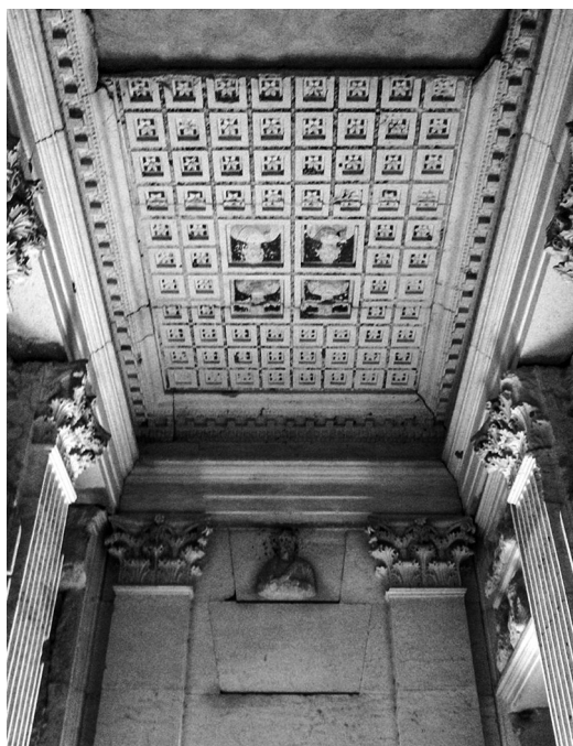
Figura 13 – Interior da torre de Elahbel, com tecto policromado.

Outros monumentos da cidade, embora não visados directamente por actos de destruição, sofreram prejuízos nos combates que se travaram em Palmira e também devido ao abandono e falta de manutenção. Quanto ao importante Museu Arqueológico, frente ao qual se levantava o Leão de Alate, o seu acervo sofreu prejuízos irreparáveis, pois foi pilhado e as peças a que foi atribuída alguma conotação religiosa destruídas ou desfiguradas, como aconteceu com numerosos monumentos funerários que incluíam figuras humanas. Grande parte destes baixos-relevos, que constituíam uma impressionante galeria de retratos, está perdida definitivamente. Uma apertada vigilância sobre os mercados de antiguidades, a ser possível, não deixará de identificar peças provenientes deste e de outros museus, em certos casos completamente saqueados. Talvez neste aspecto a intervenção internacional se revele mais importante e premente que a propalada reconstrução das ruínas de Palmira em cinco anos. Creio que, também neste caso, nos mantemos no círculo das ilusões. Se foi possível reconstruir a Ponte de Mostar, já os Budas de Bamiyan, permaneceram, naturalmente, irrecuperáveis. Como