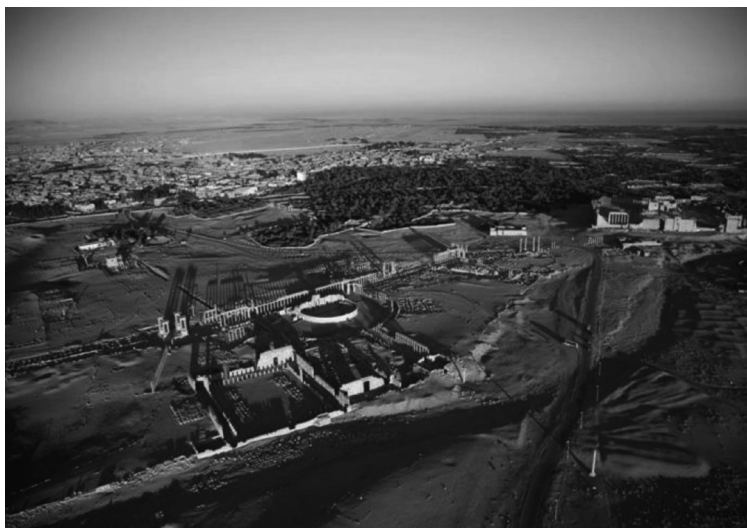
Figura 7 – Vista parcial das ruínas de Palmira, identificando-se alguns dos seus monumentos principais.

helenística, a planta de Palmira não corresponde ao modelo hipodâmico normal, menos ainda ao modelo ortogonal romano, embora se lhe atribua um Decumanus com um traçado sinuoso, com quebras de direcção disfarçadas por um tetrápilo e por um arco honorífico, e um Kardo , situado no limite oriental da cidade, continuando a estrada vinda de Damasco. O forum ou ágora comercial ocupa uma posição excêntrica, no limite urbano, junto à muralha construída por Zenóbia e reforçada por Justiniano, embora perto do teatro. Não houve, portanto, um planeamento homogéneo, orientando-se os eixos principais de forma a comunicarem com os templos principais, o que parece ser nítido no caso do Decumanus e do santuário de Bel (Fig.7), que terá levado ao desvio do uádi al-Kubur para sul. Já se avançou a hipótese de a rua ter sido traçada de forma a sugerir o movimento aparente do Sol, desde o templo de Bel até ao templo de Alate, na extremidade oeste da cidade, o que creio pouco credível. Por outro lado, as insulae a noroeste da cidade, longas e estreitas, definem um padrão regular de ruas paralelas per strigas , sugerindo um plano integrado 44 . A área no interior da muralha, cujo perímetro ronda os seis quilómetros, era inicialmente mais vasta, indicando uma população elevada, ainda que, como quase sempre acontece, difícil de calcular.