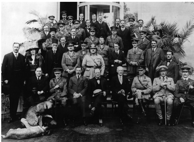
Figura 4 – Participantes na Conferência do Cairo. Distinguem-se Churchill, Allenby, Lawrence e Gertrude Bell.

Para quem conhece alguma coisa da história do Próximo Oriente posterior ao desaparecimento da opressão otomana, o desenho territorial do ISIL parece inspirado no que ficou por cumprir das ilusões do grande Reino Árabe de T. E. Lawrence, se é que alguma vez houve intenção de criar esse grande Estado, que os acordos Sykes-Picot e o falhado tratado de Sèvres mostram nunca ter passado de uma ficção 15 . Na verdade, tudo o que se encontrava a norte da Arábia foi dividido por franceses e ingleses 16 , criando o mapa actual da região: Palestina, Jordânia, Iraque, Síria e Líbano. Uma figura menos conhecida, a extraordinária Gertrude Bell 17 , arqueóloga e conselheira de Winston Churchill na Conferência do Cairo, em 1921 (Fig.4), teve uma acção decisiva na formatação territorial do Iraque 18 , cometendo um erro de consequências gravíssimas ao incluir os Curdos no reino criado para Faisal, ou melhor, para servir os interesses britânicos nos recursos petrolíferos da região.