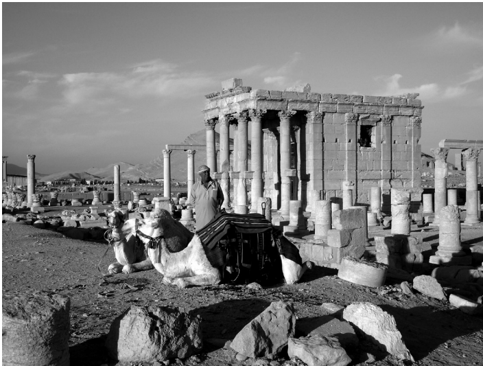
Figura 9 – Os camelos turísticos e o templo de Baal Shamin, em 2010.

Outra vítima jihadista foi o templo de Baal Shamin, que no período bizantino foi transformado em igreja e depois em mesquita. Este templo encontrava-se muito bem conservado e o tecto da cela possuía uma exuberante decoração. Era um edifício tetrastilo, pseudoperíptero, de ordem coríntia, com as paredes exteriores da cela dotadas de pilastras e com uma janela, elemento pouco usual na arquitectura religiosa romana ocidental mas que ocorre noutros monumentos de Palmira, nomeadamente no templo de Bel. As colunas ostentavam as usuais mísulas para sustentar as desaparecidas estátuas, provavelmente em bronze (Fig.9). O templo de Baal Shamin, o Senhor dos Céus de origem síria, normalmente interpretado como Zeus ou Júpiter, foi reconstruído por um notável local em 131, para comemorar a visita do imperador Adriano à cidade, mas o Temenos do santuário é anterior 51 . O templo de Tébessa ( Theveste ), na Argélia 52 , seguramente posterior, recorda pelo estilo, dimensões e elementos orientalizantes nele identificados, a arquitectura deste templo de Palmira.