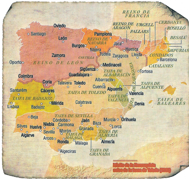
Fig. 2 - A Península Ibérica depois da reconquista de Coimbra (1064).