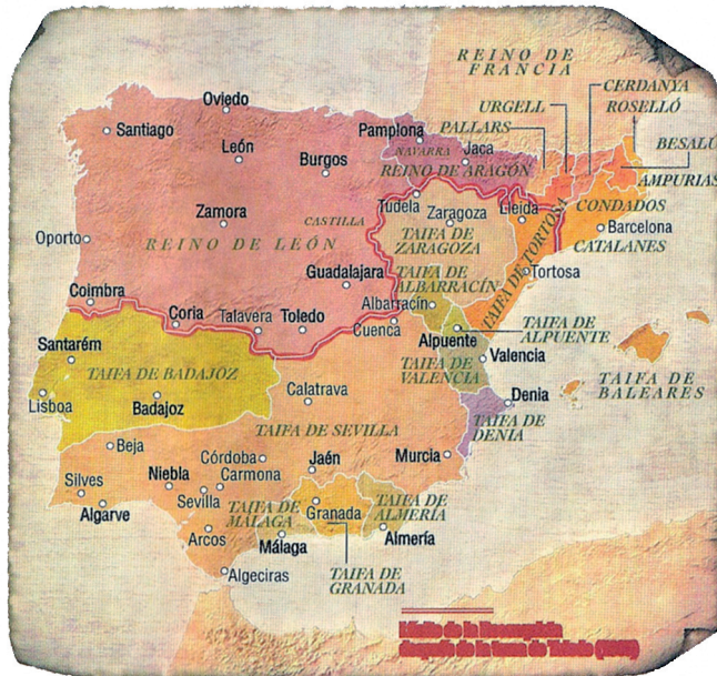
Fig. 3 - A Península Ibérica depois da reconquista de Toledo (1085).