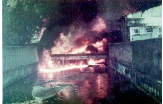
Fot. 2 - Incêndio do Córrego de Outeiro.

altura “corriam” pelo córrego, passando pelo centro da cidade até chegar no canal de São Sebastião, causando uma maré negra. O evento gerou muito pânico na população, provocou o congestionamento das estradas, deixou a cidade sem eletricidade, sem telefone e sem água, e provocou uma vítima fatal (J. M. Platon, 2010, I. Poffo, 2011).