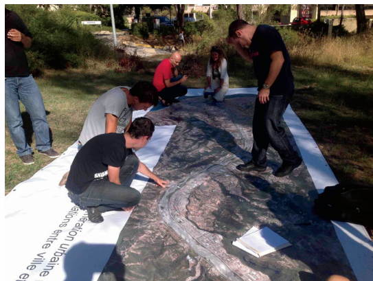
Fot. 7 - Quarta-feira, 18 de setembro de 2013, o dispositivo é testado em frente ao laboratório Géoazur.

Para ilustrar estes métodos, propomos três exemplos. Os dois primeiros foram utilizados em um estudo realizado em 2013, na bacia do Vallée du Var, localizada no território da cidade de Nice, no sul da França e conduzidos por Jacques Lolive. A Carte de Gullive é um dispositivo de pesquisa participativa. Uma grande fotografia aérea da bacia do Vallée du Var, plastificada, de 8 metros por 3 (reprodução a grande escala 1/3000) é colocada ao ar livre. Os participantes são convidados a colocar os post-it (ou desenhar com giz indicações) na foto aérea para expressar suas reações e seus comentários. Algumas questões são colocadas como: Quais são os locais que eles apreciam? Quais são as transformações atuais? O rio (no caso, da Bacia Vallée du Var) é perigoso? (fot. 7).