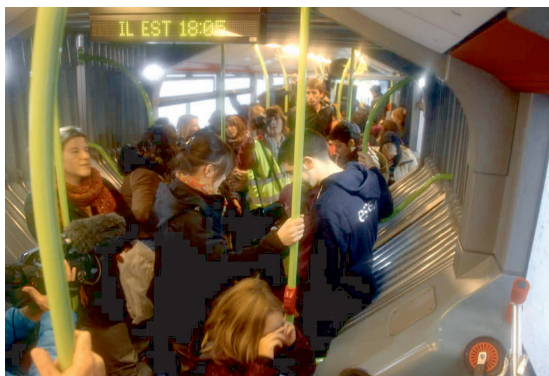
Fot. 3 - Jour inondable: Le concert de sirènes.

O concerto de sirenes (le concert de sirènes, fot. 3) . É anunciado a evacuação dos habitantes de Tours pois esta será inundada. A Defesa Civil embarca as pessoas em um ônibus para levá-las em um lugar seguro. Neste ônibus, as janelas foram “embaçadas” para que as pessoas não pudessem ver o que acontecia do lado de fora. Dentro do ônibus, um alto-falante transmitia o som de sirenes, sons de alerta e uma leitura do Plano de Salvaguarda da cidade (planejado pelos atores das ações ordinárias em caso de catástrofe). Foi uma criação sonora assustadora que informava como os dispositivos de gestão de emergência se colocavam em ação.