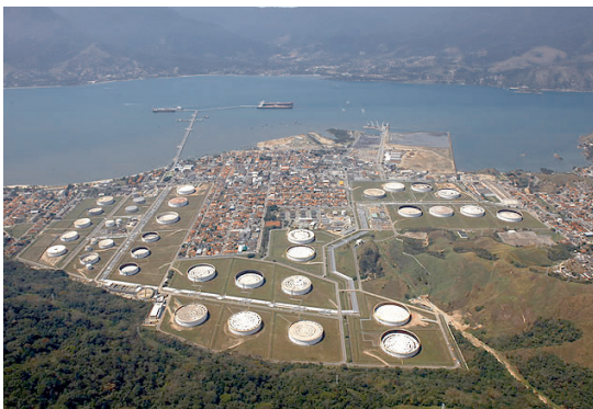
Fot. 1 - Terminal Marítimo Almirante Barroso - Tebar (Fonte: Petróleo Brasileiro S.A - Petrobras).

A cidade de São Sebastião, com 81.718 habitantes (IBGE 2014), situa-se no litoral norte (Estado de São Paulo), a 2,5 km de Ilha Bela e a 200 quilômetros ao leste da cidade de São Paulo. A cidade abriga o maior terminal de petróleo da América Latina, propriedade da empresa PETROBRAS, conhecida por TEBAR - Terminal Almirante Barroso, que recebe cerca de 50% de todo o petróleo que chega ao país. Os enormes tanques do TEBAR partilham o espaço com três distritos residenciais, com o centro histórico e o centro comercial da cidade (fot. 1).