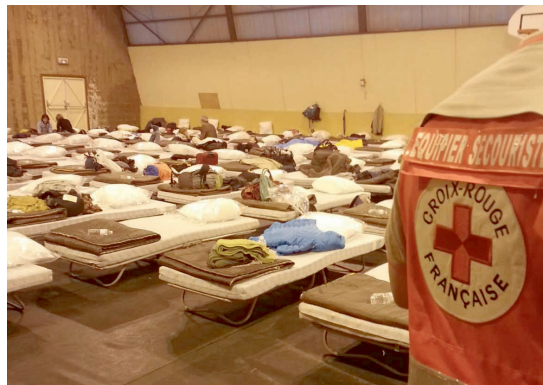
Fot. 4 - Jour inondable: La ville boit la tasse.

os participantes assistem ao documentário de Spike Lee When the levees broke sobre o furacão Katrina em Nova Orleans. O filme permite imaginar com uma grande precisão a dimensão realmente trágica do desastre, mostrando, por exemplo, cadáveres que flutuam na água. Em seguida, os participantes vão dormir na grande sala do ginásio convertida em dormitório (fot. 4).