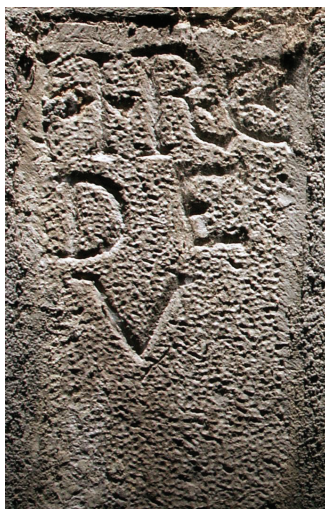
Imagem 1 – Reprodução fotográfica das iniciais HRC, a seguir às quais foi colocada, posteriormente, a identificação do sequente proprietário - V.DE – a Universidade de Coimbra, herdeira dos bens do Hospital, após a sua extinção, em 1772.

que acolhe uma típica loja de comércio oriental revela, ainda, no seu interior, arcadas e colunas manuelinas. Mas, pouco adiante, podem ver-se pedras que falam... Sobre o umbral da porta de uma casa, na rua Direita da baixa coimbrã, que na verga tem o número 73, está o registo epigráfico com a sigla HRC, formada pelas iniciais do nome da instituição, com as quais se identificava a posse de seus bens, sendo usadas também nos marcos de demarcação de propriedades rústicas.