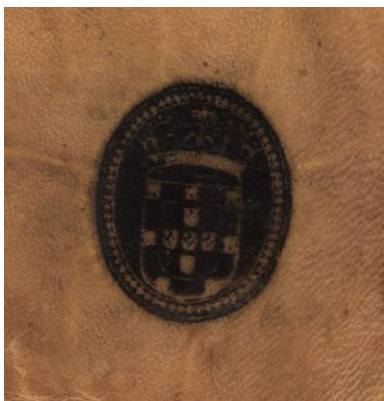
Imagem 3 – O sinete da instituição apresentava também as armas reais. Atente-se na marca do sinete que se encontra aposto na capa do livro de entrada e saída de doentes (1711-1713) (PT/AUC/HOSP/HRC/17/003).