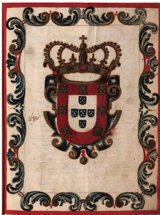
Imagem 2 – Desenho inserido no Regimento manuelino do Hospital Real de Coimbra (1508), apresentando as armas reais, testemunhando a fundação régia da instituição. (PT/AUC/HOSP/HRC/02/001).

Elaboração: 2010-09 e 2014-12; revisão 2015-01 e 02.