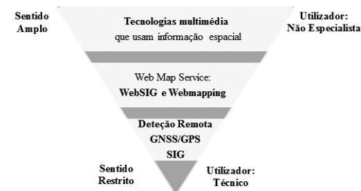
Figura 1 Diferentes concepções das TIG.

Da revisão da literatura relativa às TIG torna-se evidente que este não é um conceito consolidado, na medida em que não há uma definição consagrada. O facto de ser uma área em franca expansão contribui para que seja um termo cuja definição corre o risco de desatualização. Sublinha-se a noção de que as TIG são uma área multidisciplinar em constante evolução, com limites fluídos e marcada pelo desenvolvimento colaborativo de aplicações de tecnologias de informação geográfica de código aberto e licenciamento livre, de acordo com o preconizado pela Open Source Geospatial Foundation (OSGeo) ( http://www.osgeo.org/ , 2012).