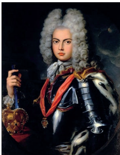
D. João V por Pompeo Batoni

mais: o volume O Portugal de D. João V visto por três forasteiros (1983), organizado por Castelo Branco Chaves, tendo embora sido publicado depois do Memorial do Convento , recolhe testemunhos da época e dos costumes do Portugal do século XVIII, testemunhos não de todo desconhecidos quando o romance foi composto. Acresce a isto o facto de, num dos relatos ali reunidos, se aludir a uma espécie de Blimunda, que assim poderá ter tido um referente lendário na realidade de então, sem ser uma personalidade histórica no mesmo sentido “denso” em que o afirmamos a propósito de D. João V ou de Domenico Scarlatti 3 . Além disso (e julgo que este aspeto está por explorar), a imagem de D. João V é também a dos retratos que dele foram pintados, antes de Saramago o investir da categoria de personagem ficcional.