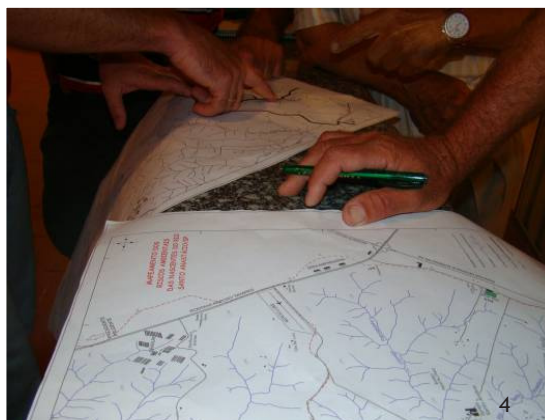
Foto 1, 2, 3 e 4 - Reunião pública de mapeamento ambiental participativo no bairro Noite Negra.

Autores: Amílcar G. C. de OLIVEIRA, Daiana F. de OLIVEIRA (14/12/2010).