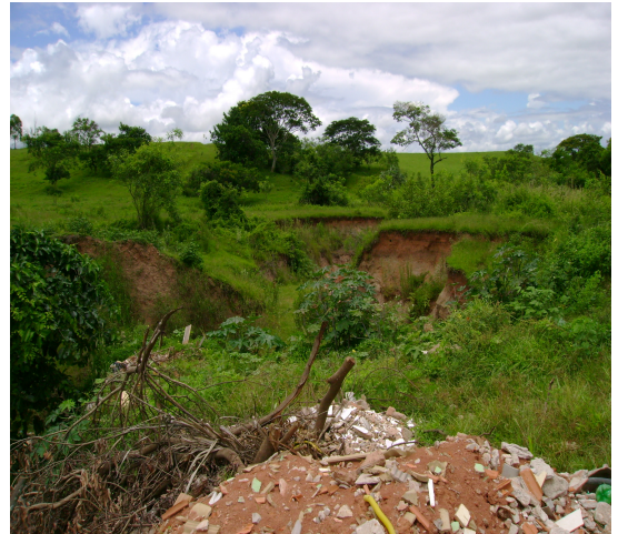
Foto 5 - Deposição irregular de entulho em voçoroca situada em área de expansão urbana no distrito de Espigão, sub-bacia do Córrego do Imbiri. Autora: Franciane dos SANTOS, 14/01/2011.

encontradas na bibliografia sobre a área e nos trabalhos de campo como por exemplo, a ocorrência extensiva de processos erosivos, inclusive com a presença de voçorocas, que é o nome dado no Brasil para formas de erosão linear acelerada. Outras situações de risco observadas nos trabalhos de campo foram a disposição inadequada de resíduos sólidos (fot. 5), riscos relacionados à escassez e poluição das águas, alterações ambientais decorrentes do avanço da urbanização desordenada e a dificuldade de acesso das diversas comunidades aos serviços de saneamento básico.