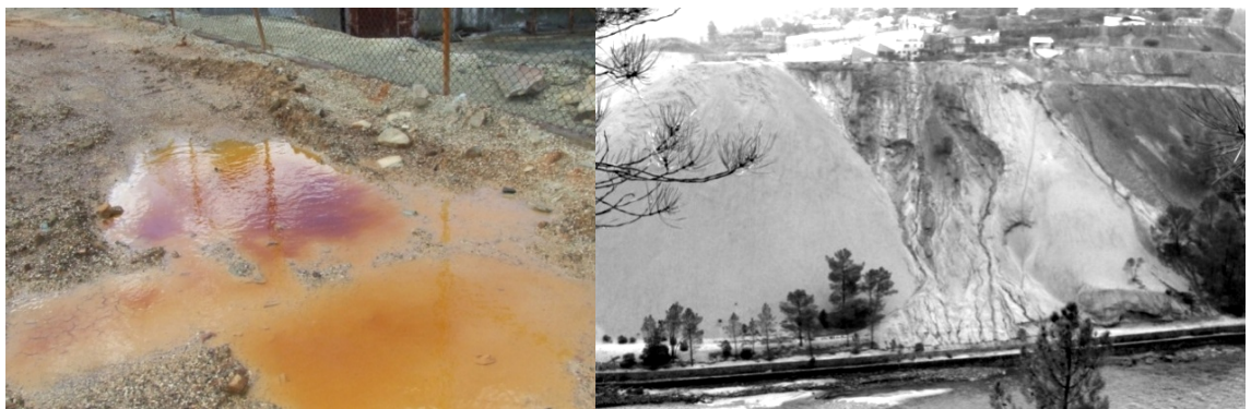
Foto 3 e 4 - As escorrências ácidas são visíveis nas antigas instalações no Cabeço do Pião da BTWP escorrência visível nas escombreyras que contactam com o rio Zêzere.

A escombreyra recente da Barroca Grande, prolonga-se ao longo de cerca de 1,5 km, ao longo desta ribeira, apresentando declives bastante acentuados e a inexistência de qualquer tipo de vegetação que trave a velocidade de escorrência da água, torna-a um potencial fonte de contaminação por águas de percolação e por escorrência. Além disso os desmoronamentos poderão também ocorrer, pois a escombreyra é constituída principalmente por partículas de quartzo, xistos,