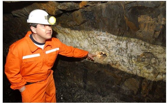
Foto 1 - Filão mineralizado sub-horizontal na mina da Panasqueira.

Relativamente aos solos desta área analisada e segundo a Carta de Solos de Portugal na escala 1:50.000 - 20 D (1980) e a Carta de Capacidade de Uso do Solo de Portugal na escala 1:50.000 - 20 D (1980), os solos que principalmente ocorrem a norte da Aldeia da Barroca