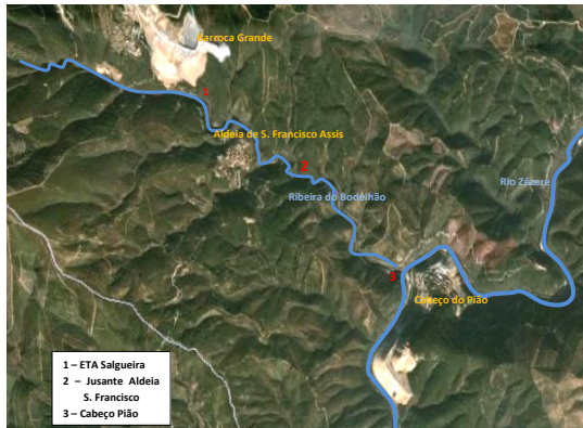
Fig. 1 - Enquadramento e localização dos pontos de recolha de amostras de água.

O centro mineiro criado pela Beralt TIN & WOLFRAM situa-se na povoação da Barroca Grande, onde hoje se concentra toda a actividade mineira. Dista cerca de 30 Km da vila do Fundão e 40 Km da vila de Pampilhosa da Serra.