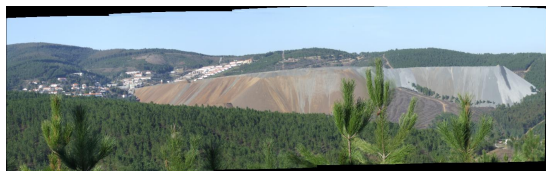
Foto 2 - Escombrelas activas na Barroca Grande. Foto do autor em Janeiro de 2010.

A ribeira do Bodelhão contorna as actuais escombrelas, num vale paralelo às mesmas (foto 2). Para esta são drenadas as águas de escorrência das escombrelas e as águas tratadas na Estação de Tratamento de Águas da Salgueira (ETA) (onde se incluem as águas vindas do interior da mina).