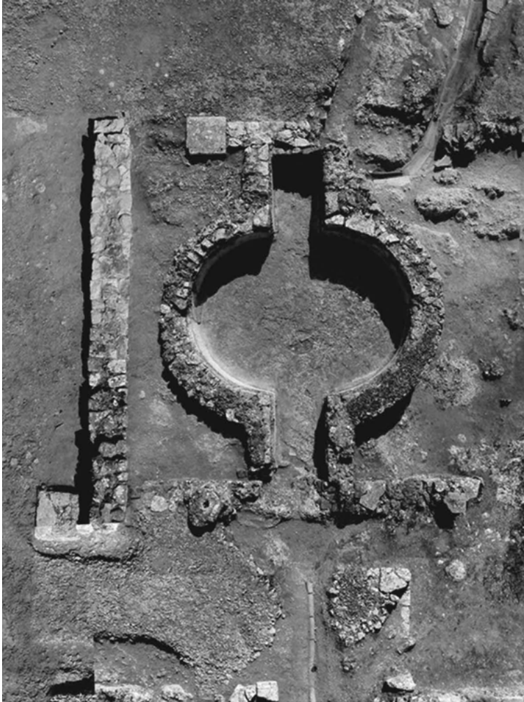
FIG. 2 – Vista vertical do baptistério da basílica paleo-cristã de Conimbriga, no seu estado actual.