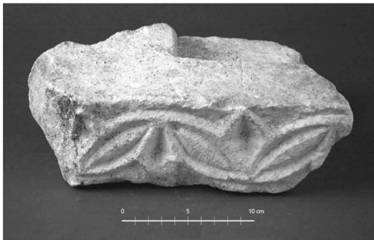
FIG. 3 e 4 – Elementos de escultura decorativa recolhidos em escavações arqueológicas na basílica paleo-cristã de Conimbriga, ilustrando os dois motivos principais do programa decorativo: 1, Pilastra 73.CBas.79 (róleos de vinha); 2, Friso (?) 79.Bas.Q1 (hermicírculos secantes).