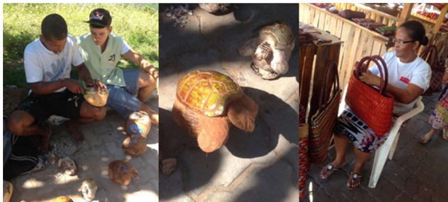
Figura 2 - Saberes e fazeres da comunidade. Fonte: Tula Ornellas, 11 de abril de 2014.

A escolha da Escola, campo de pesquisa, decorre: de estar inserida no circuito do turismo nacional e internacional, com grandes projetos imobiliários e de elevada circulação de capital; a escola abriga oito (8) turmas de EJA, no turno noturno, atendendo estudantes de quinze (15) localidades; e, o município onde a escola está situada se destaca como o segundo mais violento do país. A população residente é formada, na maioria, por jovens, com baixo poder aquisitivo e nível de escolaridade. A área contrasta com rápido crescimento imobiliário, a exemplo de hotéis, resorts e casas de veraneio. O conhecimento da região e a aproximação com os sujeitos da pesquisa apontam para a necessidade de uma escola que promova uma EJA contextualizada e inclusiva dos valores, saberes e fazeres dos jovens e adultos. O saber tradicional entendido nesta pesquisa como conhecimento local, associado à cultura e às práticas sociais. É um saber que, segundo Muñoz (2003, p. 285), vem de “práticas comunitárias do saber ser, saber estar, saber dar uso, de um mundo que se reconhece na convivência e nas práticas”, que nem sempre a escola reconhece e valoriza (figura 2).