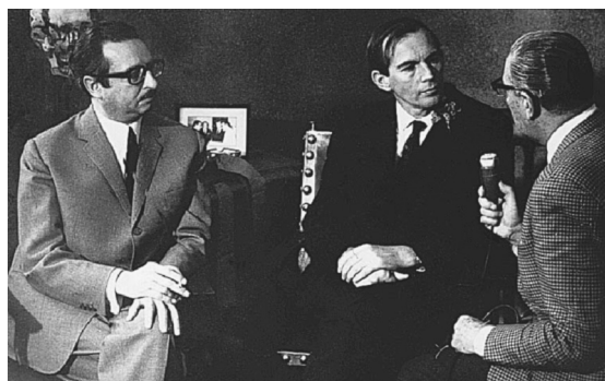
Visita e conversa televisonada com o Professor Christian Barnard, Coimbra 1968