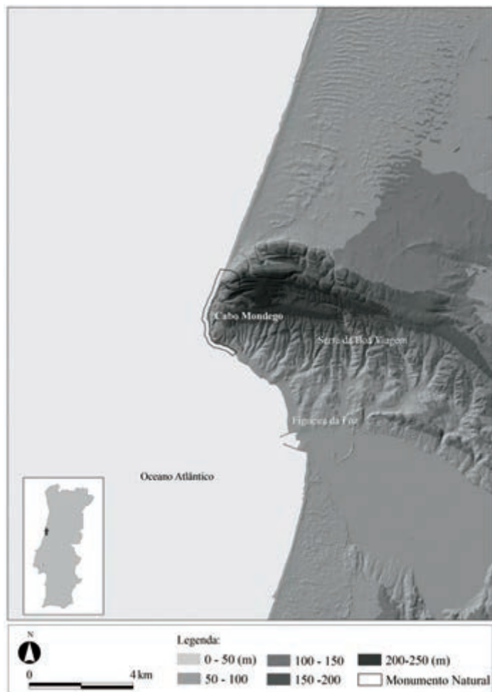
Fig. 1 – Localização do Monumento Natural do Cabo Mondego.