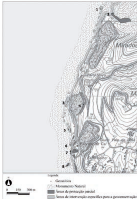
Fig. 4 – Planta de Síntese de parte dos geossítios sobre o modelo digital de terreno.

Espera-se que o trabalho agora produzido contribua para a valorização do Monumento Natural do Cabo Mondego e do seu património geológico, e que incremente a percepção pública acerca da importância da geoconservação na implementação de políticas de conservação da natureza e do ordenamento do território.