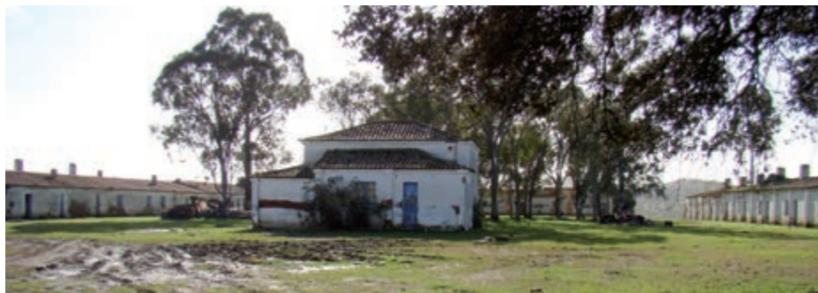
Fig. 4 – Mina de Aparis. Bairro mineiro com edifício escolar no centro.

Esta sucessão, além do seu valor paleontológico, é também peça importante no que respeita ao conhecimento da evolução tectono-sedimentar da região de Barrancos, nos tempos devónicos.