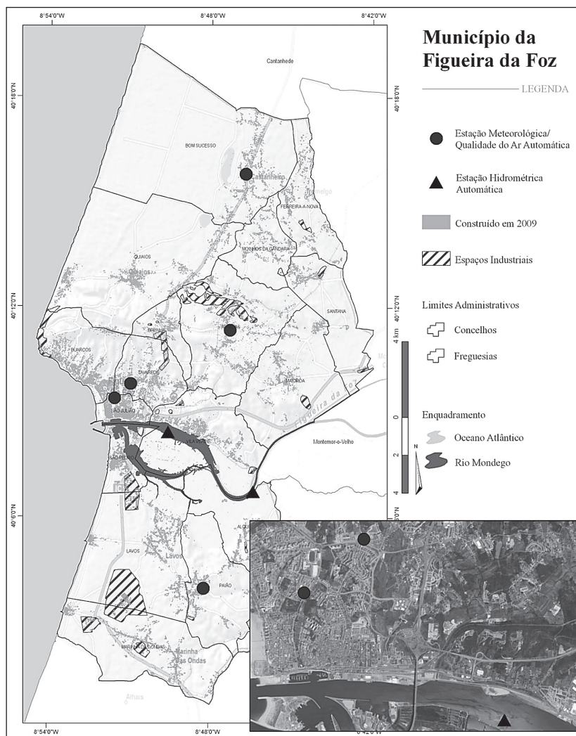
Figura 3 Esboço de localização dos postos de monitorização ambiental no Município da Figueira da Foz.

Por sua vez, o acompanhamento do sistema aquático, deverá vir a ser conduzido por duas estações hidrométricas. Uma já existente e sob manutenção do