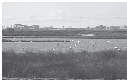
Fotografia 1 Vista geral da ilha da Morraceira

Justificava-se, assim, a implementação de um projeto integrado que mais do que enunciar um conjunto de medidas de conservação, pugnasse pela valorização turística - cultura e património -, mas fundamentalmente, pela valorização dos próprios ecossistemas (CORDEIRO, coord, in press-b ).