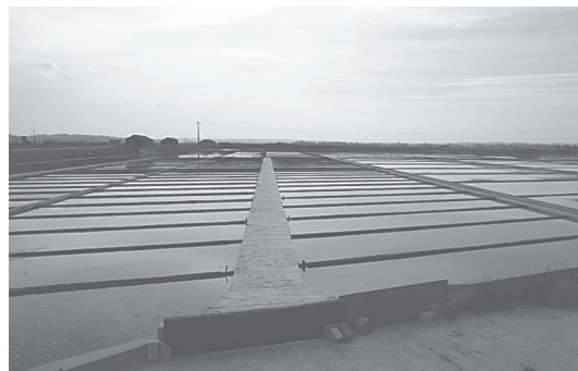
Fotografia 2 Marinha de sal