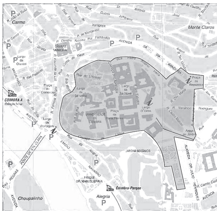
Polo I da Universidade de Coimbra