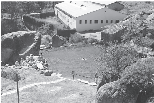
Figura 7 Praia Fluvial, em Loriga. Vista panorâmica desde a localização de uma cache.

Neste percurso pelos espaços da água, ao geocacher são também apresentados os territórios da produção energética, das centrais hidroelétricas do Sabugueiro e da Senhora do Desterro à central e à câmara de carga da Ponte Jugais, todas com a respetiva cache, todas no mapa dos geocachers que visitam a região. No caso da Central da Senhora do Desterro, a cache assinala uma inovação - o Museu Natural da Eletricidade, inaugurado em 2011, mas já registado na rota das caches deste município. É certo que estas caches se ajustam à geografia do património tradicional (no que à museologia diz respeito, registre-se também o Museu de Arte Sacra, em Alvoco da Serra), mas procuram também o que se faz de diferente, as patrimonializações inovadoras de recursos que já não são novos, como ocorre com o Museu do Pão, em Seia, deixando a ideia que se poderá percorrer parte substancial dos espaços museológicos desta região seguindo as orientações de um GPS que procura as caches escondidas no terreno. É também para se mostrar o que acontece de novo que se colocam caches em lugares de investimentos recentes, sinais de progresso e qualidade de vida, como acontece, mais uma vez no ambiente água, com a sinalização de espaços intervencionados como as praias fluviais de Lapa dos Dinheiros ou Loriga (Figura 7).