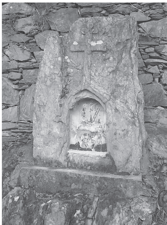
Figura 3 Alminha de Xisto, em Cabeça.