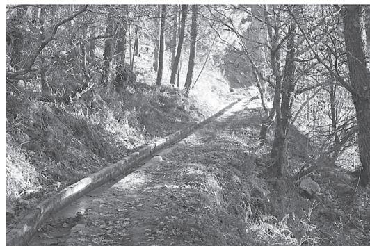
Figura 6 Levada, no percurso que conduz a uma cache, perto de Valezim.

Este percurso pelos territórios da água levou os geocachers a fontes, lugares que já foram mais do que são hoje, antigos espaços de sociabilidade, pontos de encontro quando a água não chegava, como hoje, bem preparada, quase sem esforço, à casa de cada um. A Fonte dos Azeiteiros, em Loriga, ainda procurada porque a água é fresca, mas também a Fonte do Ferreiro, no Sabugueiro, lá estão, nesta rede de caches que homenageiam a água, não fosse a Serra da Estrela um dos grandes reservatórios hídricos do país. Por isso, nestas encostas de socacos, se levou o geocacher aos caminhos que, acompanhando levadas, refazem agora trajetos hídricos antes percorridos pelo agricultor e pelo criador de gado, calcorreando pedras já antes pisadas, retomando territorialidades agora com objetivos que não se imaginavam há não muitos anos (Figura 6).