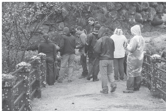
Figura 4 Geocachers em atividade, perto de Loriga.