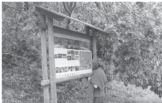
Figura 5 Geocacher observando uma das placas de informação na Mata do Desterro, onde se criou um trilho de caches.

homens. No entanto, esta espacialidade não se entende sem outro traço de personalidade geográfica, um marcador menos silencioso mas mais fluido, elemento que também modelou este espaço e esta geografia humana - a água. Nas suas múltiplas manifestações, este é outro dos elementos marcantes da experiência territorial dos geocachers neste espaço geográfico. Na aldeia de Barriosa (freguesia de Vide), a cache lá está, na cascata do poço da Broca, pelo que se vê mas também pelo que se ouve, talvez uma paisagem sonora terapêutica, “um dos locais mais belos da região”, assim o promove quem colocou a cache, num lugar também de suposições, de transmissão do que se diz, que a ponte que ali está seria romana, que a tiveram que ajustar para a passagem dos cavalos, que alguém, não se sabe quem nem quando, ali queria construir uma capela, sem nunca o ter conseguido. Lendas, suposições, diz-se que foi assim, ouviu-se algures, narrativas que vão imprimindo densidade aos lugares, num geocaching que se faz entre as paisagens do real e os territórios do suposto, quando não, do imaginado.