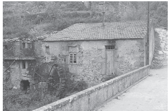
Figura 8 Antigo lagar, em Valezim.

mas que deixaram rasto numa paisagem que teima em avivar memórias. Esta é a viagem do geocacher pelo antigo, pelo que já foi e agora se refuncionaliza, os restos de um moinho de água em S. Romão; uma velha e desativada central hidroelétrica em Vila Cova à Coelheira; uma fábrica em Loriga, da qual apenas sobrevivem as paredes; ou um desgastado e abandonado lagar, registo de uma paisagem pretérita de povoamento denso, uma paisagem mais vivida que exigia sustento para mais gente (Figura 8).