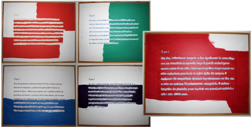
Figura 16. Montagem com algumas das obras que integram a série «Ó pus» (70 x 95 cm, cada quadro).

sua terceira fase. [...] O enquadramento é o factor essencial na instituição de uma percepção do espaço em deslocação que se epifaniza no objecto mais ocasional».