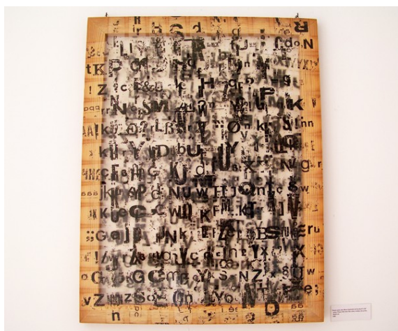
Figura 7. «Ensaio para uma nova expressão da escrita n° 278» (65 x 50 cm).

A obra de arte é, senão, matéria da vida, em toda a sua condição de maleabilidade e transformação, cuja propriedade maior é a de adaptar-se sob distintas formas. E nessa «plástica» plasticidade encontramos a própria noção de obra em Fernando Aguiar, afinal, plástico é tanto o que pode moldar como também o que pode ser moldado, tanto é o que pode adquirir como receber diferentes formas pela moldação ou pela modelação. Em seu trabalho, a materialidade é assumida sem ser suplantada pela abstração, ou seja, a apreensão estética não é relegada a segundo plano e cria cadência com o arcabouço ideológico.