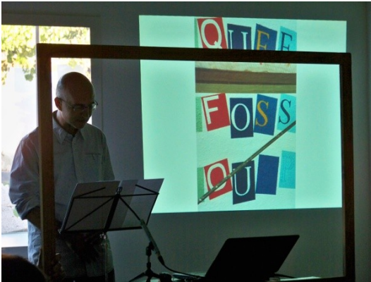
Figura 19. Na performance «escreleituras», o projeto do poema-mural «Como é que eu gostava que fosse e imaginava que podia ser» (1994, 500 x 500 cm) acabou por ser animado.