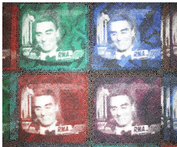
Figura 15. «recordação de Portugal» (200 x 200 cm).

convertido em ironia quando olhamos atentamente para a tela, em que são pintados, de forma pixelizada, quatro monitores a mostrarem, em cores distintas, uma mesma imagem que lembra Cavaco Silva (então há mais de dez anos no poder como primeiro-ministro e que, dez anos depois, seria candidato eleito à Presidência da República). Logo, a «recordação de Portugal» passa de lírica no título para consubstancialmente nociva – a imagem em píxeis acaba por se tornar uma metáfora com a «ampliação» da matéria. Poderíamos encaixar como trilha sonora, nesse caso, desde aquele chiado que os aparelhos televisores fazem quando estão a falhar até «Portugal Radical», dos Ena Pá 2000, com o seu «Não sei o que falar / mas tou farto de vos aturar», ou ainda «Hoje eu acordei feliz», do Charlie Brown Jr., com «Hoje eu acordei para sorrir mostrar os dentes / Hoje eu acordei para matar o presidente». Mas quem na imagem pintada realmente está a sorrir é o espectro de “Cavaco”, com toda a sua imagem mediática.