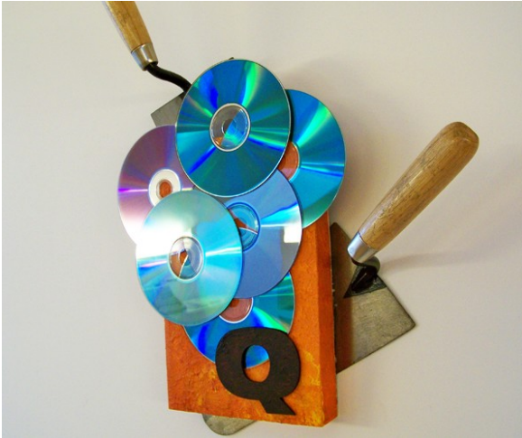
Figura 11. «Construção do romance musical» (46 x 36 x 12 cm).

peculiares marcas criadas num percurso de progresso estético-criativo que não se esgotou, que está sendo constantemente reinventado tendo em atenção (e aqui há alguma intervenção de sua formação em design ) as competências técnicas, a capacidade de transmissão de informações e a maneira perspicaz de lidar com as limitações materiais, o que acaba por fazer deste artista um dos nomes da poesia experimental que melhor soube atualizar a sua obra em toda a sua pluralidade e amálgama.