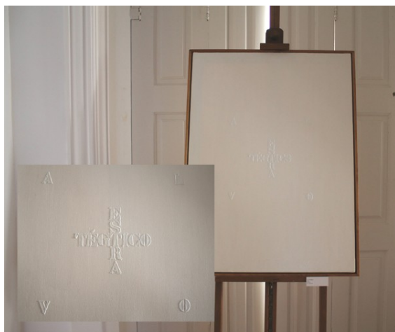
Figura 21. «alvo estratégico» (95 x 70 cm).

um preço» (1995). Em obras como estas vamos observar que «Não é por um acaso que muitos dos meus trabalhos são também sobre o alfabeto, e, portanto, pensar o alfabeto como parte desse processo de submissão à ordem da letra, mas ao mesmo tempo como qualquer coisa que tem potencial de libertação, de expressão e que pode ser apropriado, pode ser transformado, pode ser objeto de invenção», ressalva o artista.