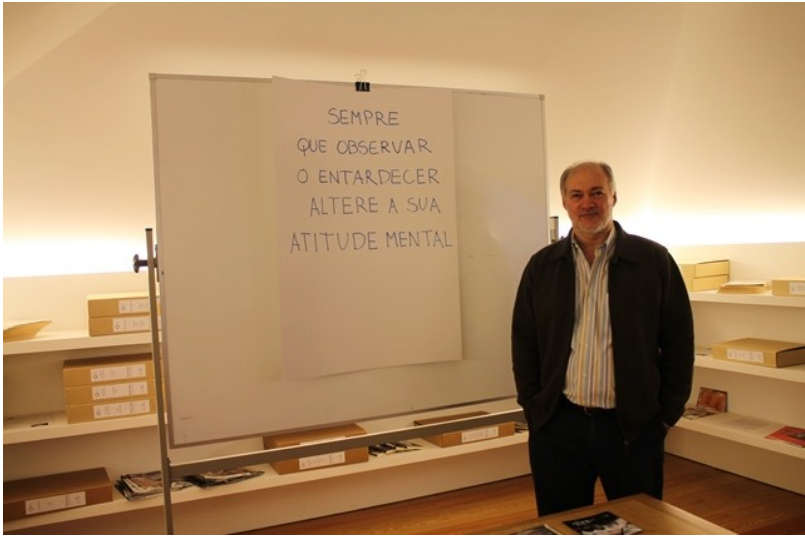
Figura 2. Fernando Aguiar e a intervenção que propôs na Biblioteca da Casa da Escrita, onde cada pessoa que lá entrasse era convidada a escolher um pedaço de papel com versos e reproduzi-los numa grande cartolina branca, com a qual seria fotografada depois. O artista conta que o projeto inicial era bastante diferente; consistia em apresentar, no único painel eletrónico da cidade de Coimbra, três seqüências de sete pequenos poemas da série inédita «Um fio de perplexidade». «O projeto, no entanto, foi considerado demasiado complexo tecnicamente, e acabou por não passar disso mesmo, e de possível interação digital passou a interatividade analógica », comenta Aguiar.

É que a matéria é aqui também valorizada como unidade fundadora de sentido, enquanto são construídas ligações entre as imagens verbais e a técnica do olhar, usufruindo-se do poder iconográfico como forma de diagnosticar superfícies materiais e delas extrair sentidos imateriais latentes. «Sempre considerei que o poema visual deveria ser uma obra que se dissesse através de uma relação íntima entre a forma e o conteúdo, e que essa seria efetivamente uma obra conseguida. Tenho, geralmente, a preocupação que os meus trabalhos contenham essa dualidade que se complementa e completa. Isto é, que não representem unicamente uma forma (des)agradável ao olhar e a uma apreensão imediata, mas que signifiquem algo para além disso», afirma Aguiar.