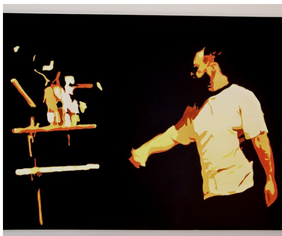
Figura 6. «Tokyo» (2003/2004, 130 x 195 cm).

A obra de arte é, senão, matéria da vida, em toda a sua condição de maleabilidade e transformação, cuja propriedade maior é a de adaptar-se sob distintas formas. E nessa «plástica» plasticidade encontramos a própria noção de obra em Fernando Aguiar, afinal, plástico é tanto o que pode moldar como também o que pode ser moldado, tanto é o que pode adquirir como receber diferentes formas pela moldação ou pela modelação. Em seu trabalho, a materialidade é assumida sem ser suplantada pela abstração, ou seja, a apreensão estética não é relegada a segundo plano e cria cadência com o arcabouço ideológico.