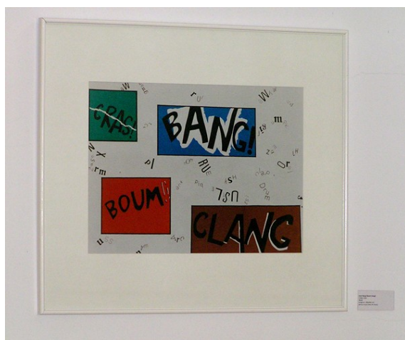
Figura 12. «Cras! Bang! Boum! Clang!», poema-mural projetado em 1988 (imagem; tinta guache sobre papel) e pintado na parede externa do edifício de uma escola em 1995 (400 x 600 cm).