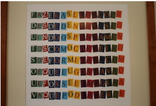
Figura 20. Detalhe da obra.

«Este é um dos problemas da arte, que é criar uma forma de representar o mundo que permita ver a própria representação e, portanto, permita ver a moldura, permita ver a forma através do qual o mundo se objetifica de uma determinada forma. Obviamente revelar uma moldura é construir outra moldura e, portanto, esse jogo é um jogo de certa forma infinito, porque qualquer perceção cria sempre qualquer coisa que está fora de si e, portanto, qualquer coisa que essa perceção não permite apreender», afirma o artista. Daí não conseguirmos encontrar um olhar que não coincida com o nosso próprio olhar, o que acaba por ser o motor de busca do trabalho de Portela e que justifica por que por vezes a contenção do campo de visão nos faz ficar mais conscientes do enquadramento – afinal, muitas vezes algo é enquadrado não pelo que se quer no enquadramento mas pelo que se quer deixar fora dele.