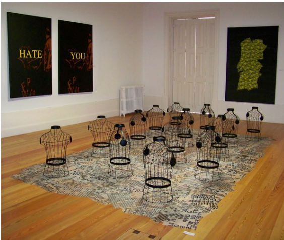
Figura 9. «Contra-texto ou anti-romance com 14 personagens» (2004/2013) ao centro, e em frente «Frágil» (2010/2013). Na parede esquerda, dois dos três quadros que compõem «Feelings» (2002).

É o que presenciamos, não obstante, em trabalhos como a série «Ensaio para uma nova expressão da escrita» (1982/1983), «Construção do romance musical» (2006) ou «Contra-texto ou anti-romance com 14 personagens» (2004/2013). Nesta última obra, aliás, e que já vai em sua terceira versão, distinta em formato e expressividade, vemos o «antropomorfismo aberto» (na expressão do próprio artista) de que falávamos, que permite uma multiplicidade de interpretações a partir, inclusive, de corpos que lembram gaiolas e cuja presença condiciona em vez de configurar a abertura desejada. Afinal, a ausência acondiciona, de um modo ou de outro, a presença, e não a falta.