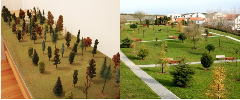
Figura 4. Maquete do «Soneto ecológico» (164 x 56 x 20 cm), concebida em 1986/1987.