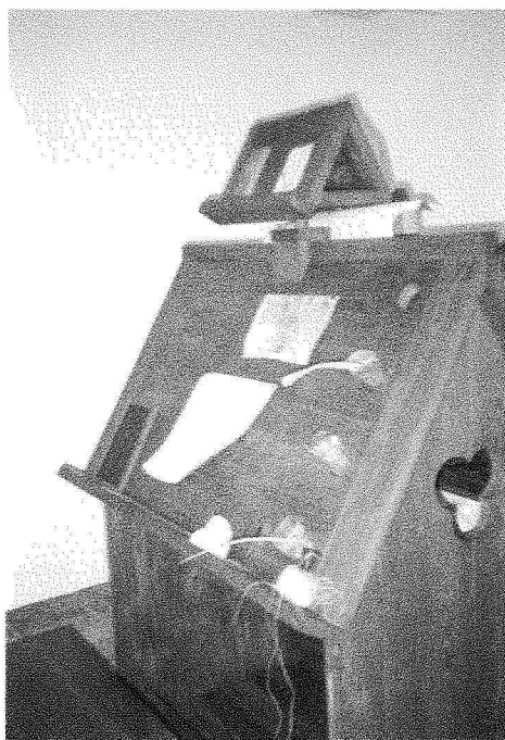
Grav. III – A “secretária” com os cornua das tintas, compasso, pedra-pomes e outros objectos.