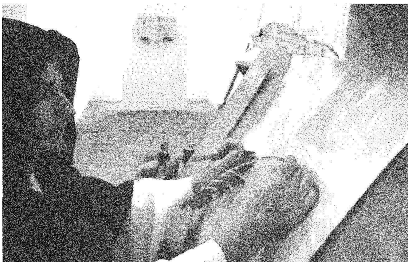
Grav. VII – «Escrever com uma faca na mão esquerda».