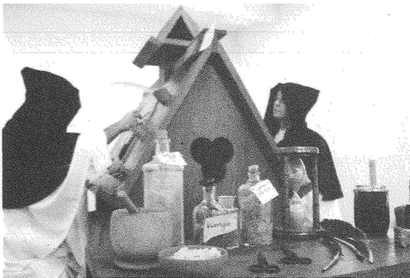
Grav. II – Pormenor dos instrumentos e produtos expostos na mesa.