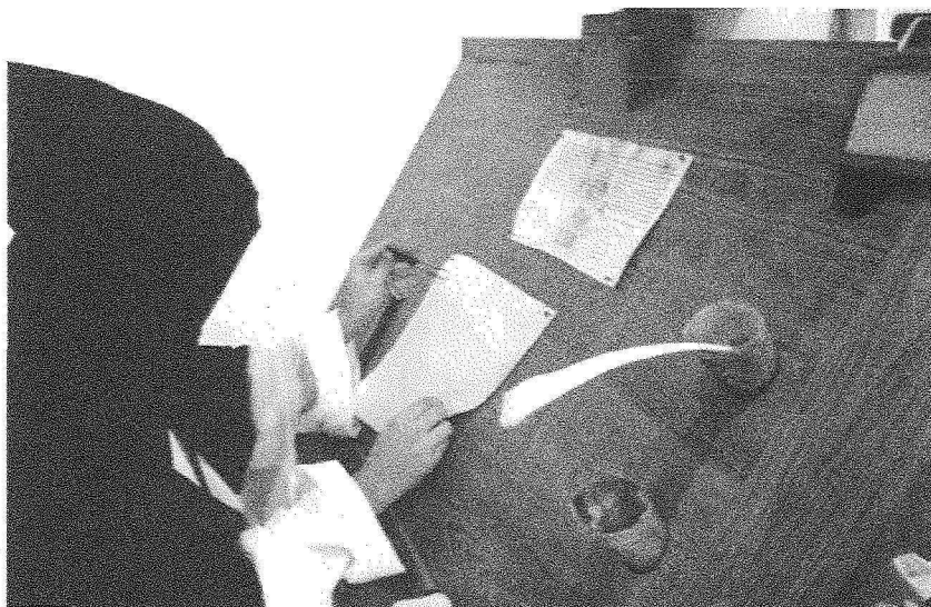
Grav. IV – A picotagem do pergaminho.