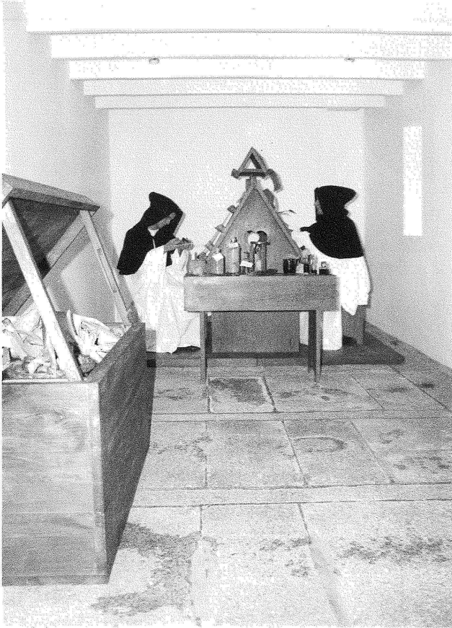
Grav. I – Aspecto geral do scriptorium .