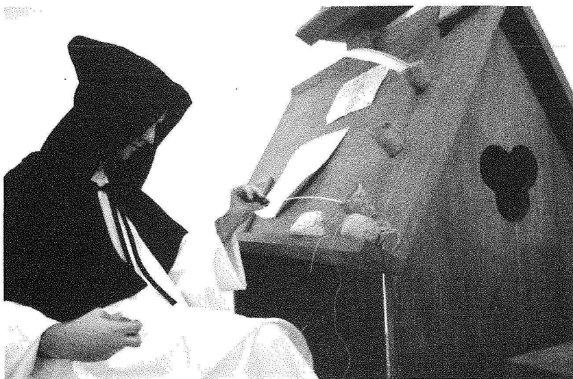
Grav. VI – O fio com que se remendava o pergaminho.